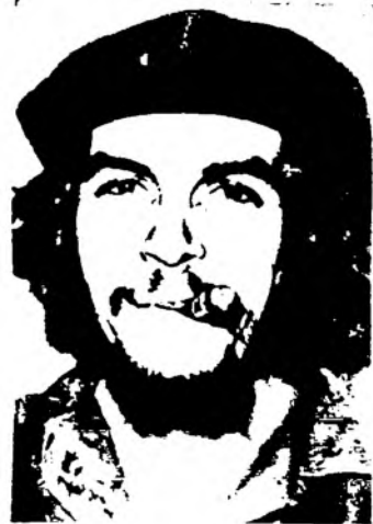
2. Dr. Ernesto Guevara.