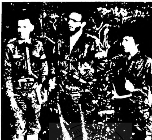
1. Fidel Castro printre lucrătorii din rețeaua sanitară în Sierra Maestra.