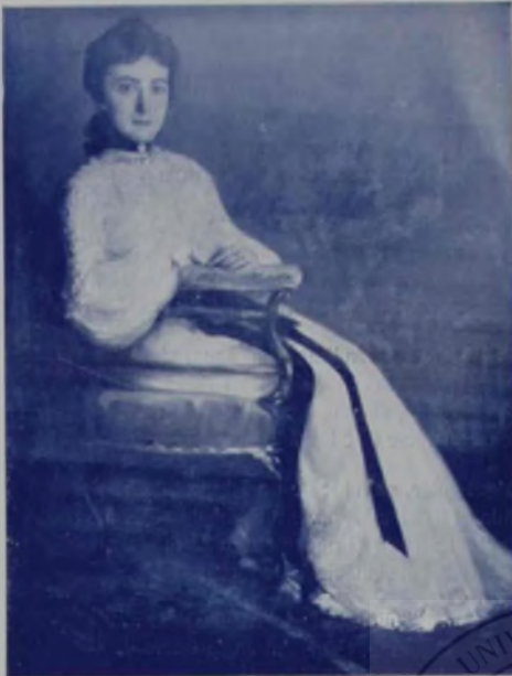
Portretul d-nei A. W.

— Noa, rămii cu D-zeu, nepoate, să știi cum să-mi zici de altădată.