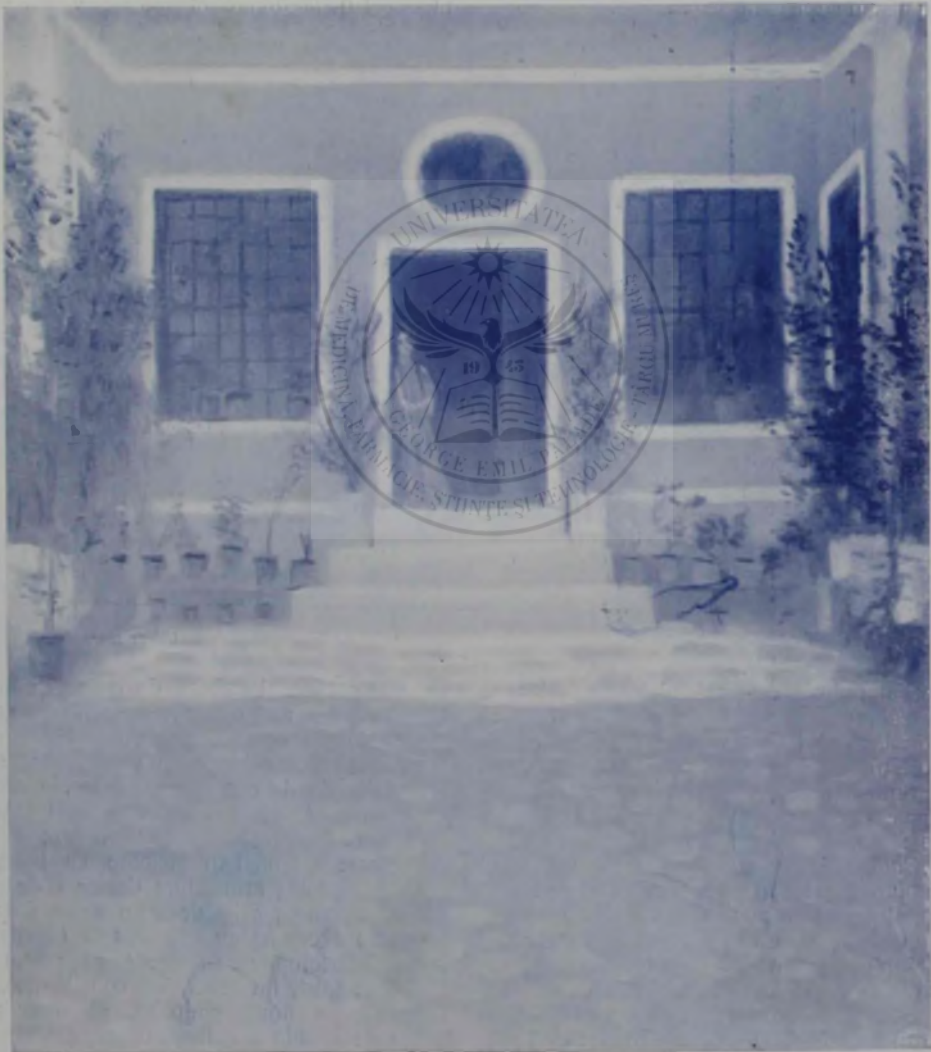
(Aparține Pinacotecel din București.)

subiecte e atras, cari s'nt ideile ce-l preocupă, forma și culoarea în cari trebuie exprimate toate acele sentimente, cind inima bate cu vioiciune, cind ochiul atent și tinăr încearcă să învăluiească în tonuri bogate și calde, ori lucruri reale, ori fantezii. Realitatea pe de-o parte, fantezia pe de alta, sint cele două laturi fundamentale în cari se pot despărți și uni picturile