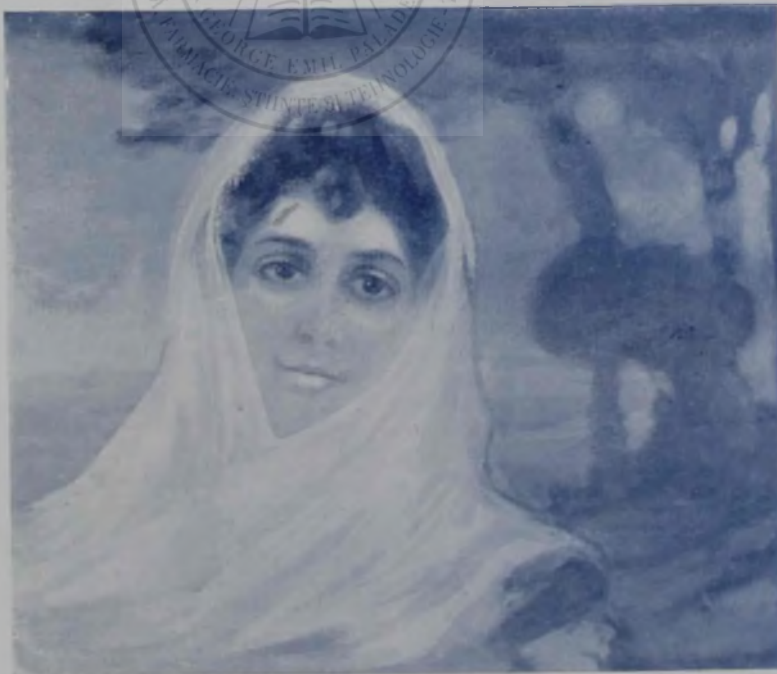
Floarea la urechte.

— Cum spun, mă întorceam dela oraș. Fusesem în căraușie. Era vremea lucrului. În sat nu era țipenie de bărbat. Cîteva femei bătrine, cu copilașii mititei, păzeau căminurile. Oamenii erau la lucru pe unde puteau... Și era o căldură, o arșiță, cum n'a mai fost și nu mai este... Și-mi ziceam în gînd, — pă-