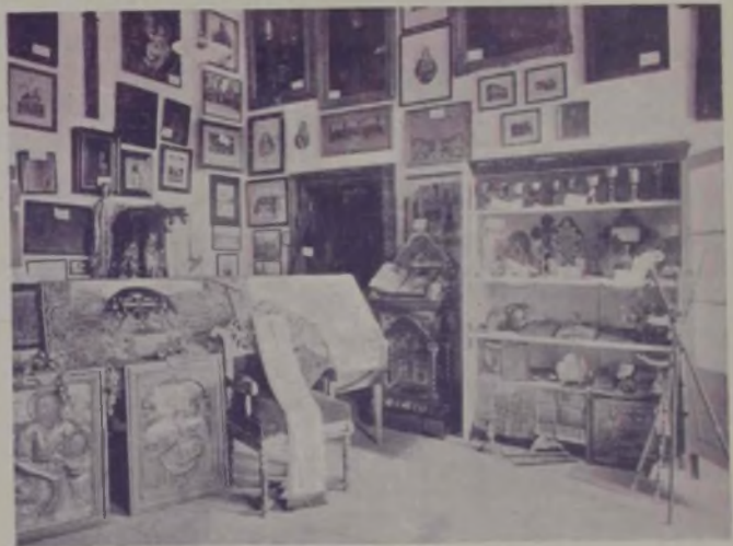
Secția bisericii ortodoxe.

Student, adevărat student, balic întii, modest și timid și măi pe urmă student format, guraliv, îndrăzneț în chestii de interes, național, cutezător în fața adversarilor săi politici, tăiat în duel pentru salvarea onoarei națiunii... ales președinte al societății „Junimea universitară”, orator distins pomenit în toate coloanele ziarelor, închis în temniță de stat în urma unui monstruos proces de agitație... ăstea erau visurile băiatului nostru în fața cărora cădea orice alt proiect pentru o viață, poate și măi bună, poate și măi ușoară, poate și măi dulce și fără multe griji.