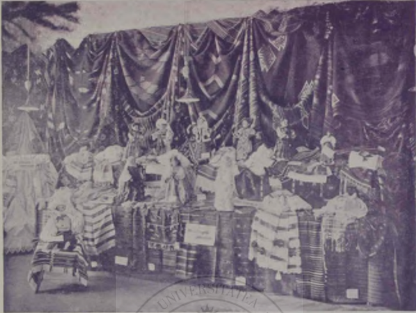
Dela expoziția din Sibiru.