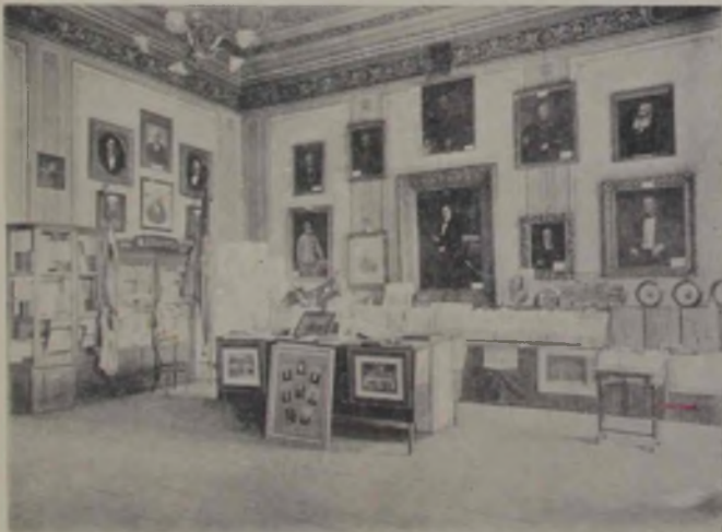
Expoziția din Sibiu: Secția istorică-culturală.

Așa i-a spus bucătăreasa: casă pustie, — și 'n ea șade Mama-Pădurii ... Copilul nu știe ce e