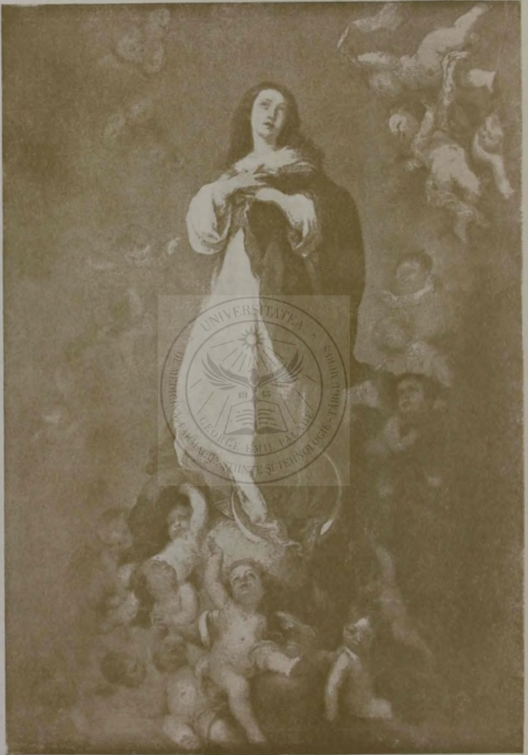
Bartolome Esteban Murillo: Concepțiunea Mariel.