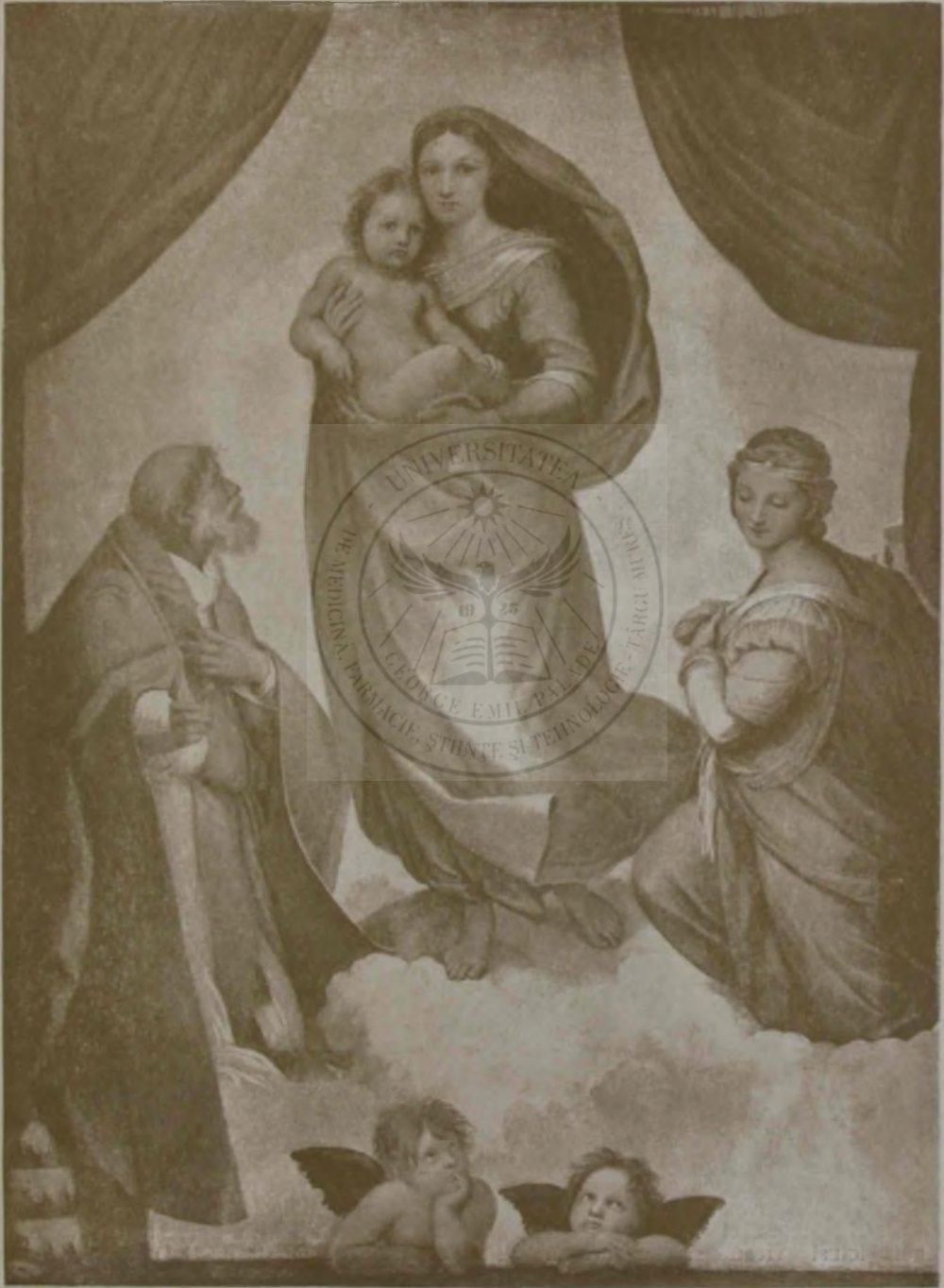
Raffaello di Giovanni Santi : Madona Sixtina