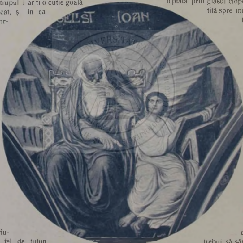
O Smighelschi: Evangelistul Ioan.

Pentru nimeni în lume n'ar fi făcut asta, să-și lase căsuța albă ca un zahăr și răcoroasă ca o Sinaie, curtea cu găini, caiul încărcat și garoafele neudate și să plece așa, — unde? Tocmai la Slatina, el, care pe vremuri cit a fost profesor de limba greacă, n'a știut altă cale decît