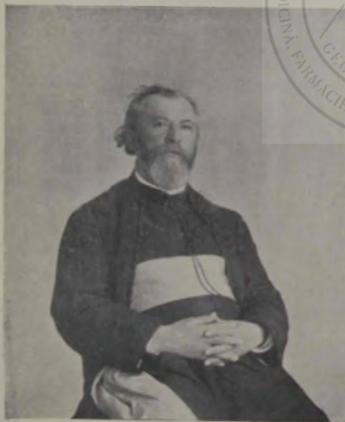
† IOSIF GOGA.

† Iosif Goga. Pe cînd glasurile arginții ale colindătorilor vestiau pe la ușile credincioșilor bucuria nașterii lui Cristos, unul dintre noi, cu ochii împaienjeniți de lacrimi, sta la căpătiul