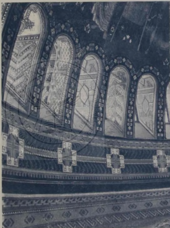
Cupola catedralei: Decorația ferestrelor.