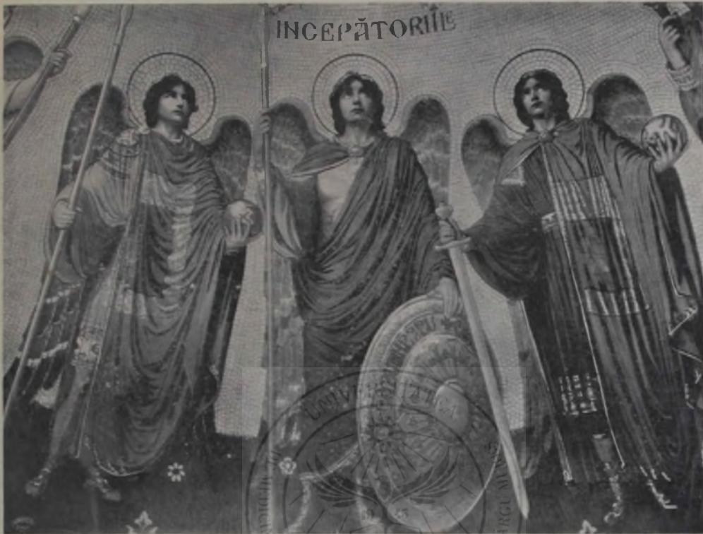
O, Smighelschi: Incepătoriiile.

— dar toți simțiau că tineretea ei, că dragostea, că viața ce venia încet-încet cu fioroase bucurii și dureri îi cutremurase sufletul.