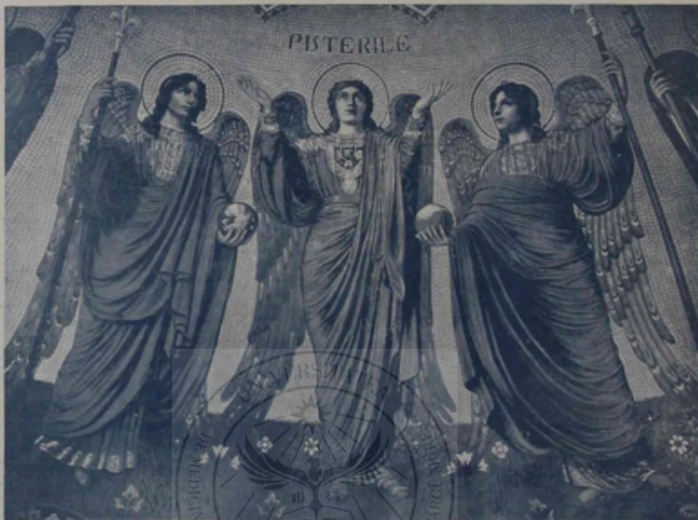
O. Smigelschi: Puterile.