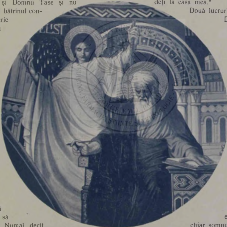
O. Smigelschi: Evangelistul Măterii.

Dumneaei învîrtia toată casa, dumneaei și cu Păuna, slugă veche, doica lui Cănuță, de care prinsese apoi atîta slăbiciune — ca de copilul ei — încît nu s'a mai deslipit de casă. Ce e drept, era și bine îngrijită; mai mult decît o prie-