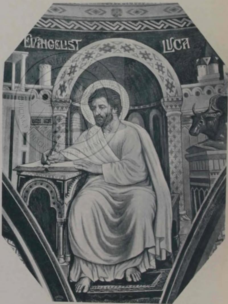
O. Smigelschi: Evangelistul Luca.

Cei doi flăcăi eșiră în bătătură și se ameste-