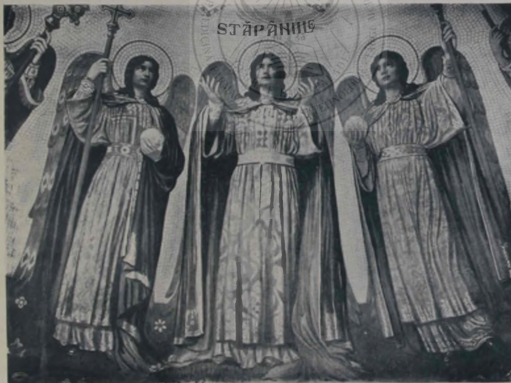
O. Smigelschi: Stăpâniile.

Popa un răstimp mare nu zice nimic. Se gîndește la ceva foarte depărtat, căci privește prin pereții odăii ca și cînd ar fi de sticlă. Apoi se scoală deodată în picioare: „Să fi avut pe cineva odată, frate, și-apoi să nu-l mai ai! Și tu să fii cel ce-i poruncești, și totuși să nu-i poți porunci! Să vezi cum ți se zdrobește o nădejde tare, și să stai cu minile în sin. Ba cînd te întilnești cu cel ce-a fost al tău, să fie destul să-ți zică o vorbă, ca tu să nu-i mai poți zice nimic. Asta s'o înțelegi tu, și-apoi să-mi