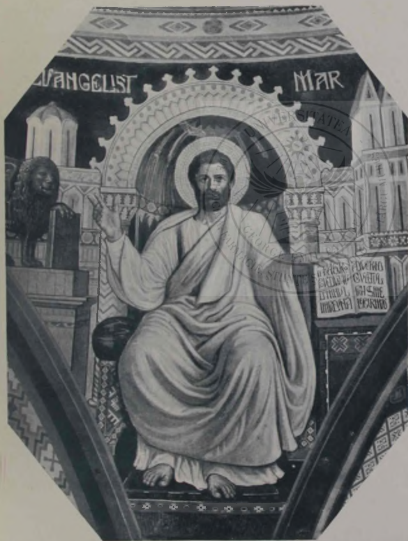
O. Smigelschi: Evangelistul Marcu.

Îi puse mina pe umăr și se dădu mai aproape de el: