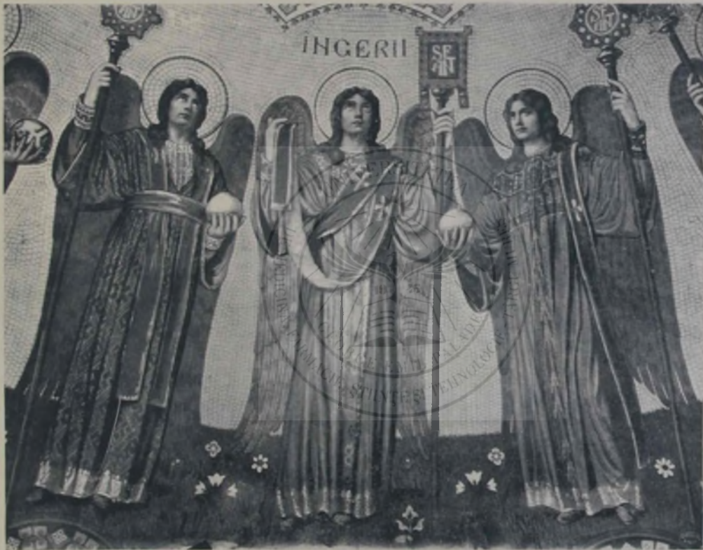
O. Smigelschi : Ingerii.

Momentele de căpetenie ale picturii bizantine, vărsate în forme artistice moderne, și aplicarea motivelor naționale, sînt factorii cari fac din pictura catedralei noastre o lucrare, care nădăjduim va forma pragul unei ere nouă în dezvoltarea picturii bisericești la Români. Ea repre-