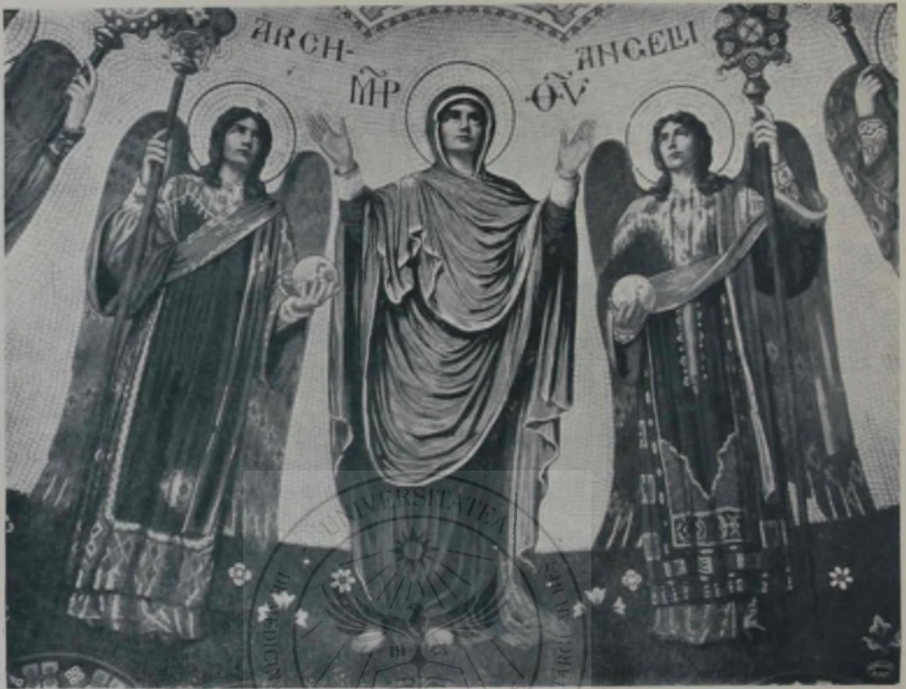
O. Smigelschi: Archangelii.

oaspe. O așa îndestulare, atîta sănătate și viață nu ți-a mai fost dat să vezi. Dacă ai fost des-nădăjduit mai înainte cînd mergeai pe drum, — cînd pleci din casa popii, simți că ai cîștigat o putere uriașă de muncă și de luptă. Și popa arăta că 'ntr'adevăr are cu ce omeni oaspeții. Copilele umblău sprintene, de să nu fi adus nici un puiū fript, nici un rind de plăcinte, te-ai fi săturat vîzîndu-le mersul. Popa să nu fi adus nici o cană de vin vechiū din pivniță, te-ar fi îmbătat numai cu muzica glasului plăcut.