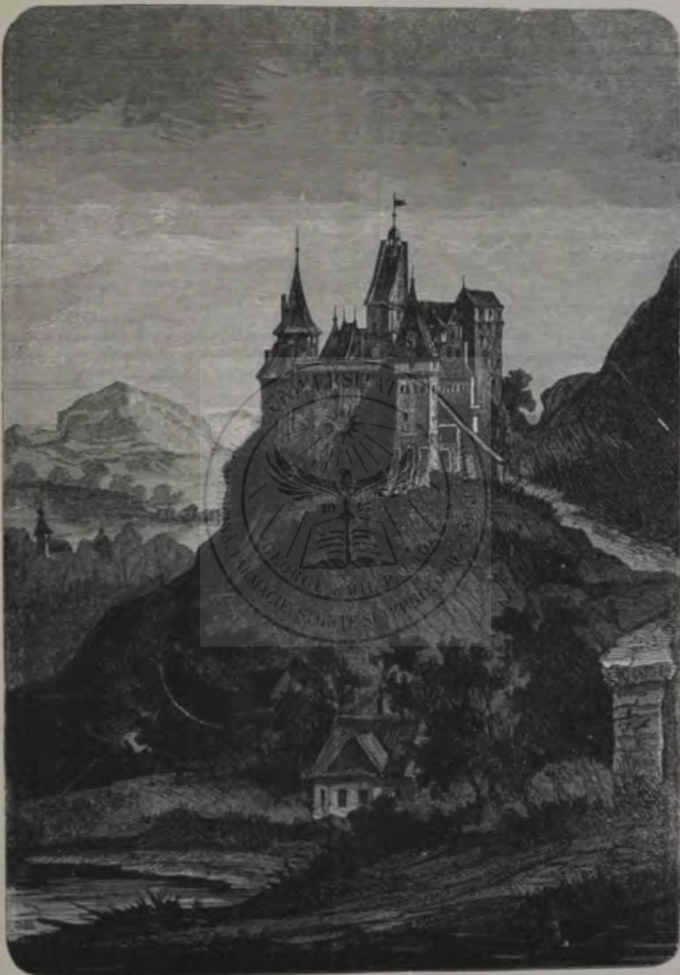
Castelul Branului. (Pag. 110.)

și adică în hă-care magnet electricitate de nume contrar. Mașina lui Gramme apropiā și depărtază magnetii unul de altul astfel, încât unul stă în loc, pe când celălalt se învērteșce împregiurul lui. Acesta se pōte vedea în micul desemn 1 de pe pag. 104, unde a este magnetul ce se