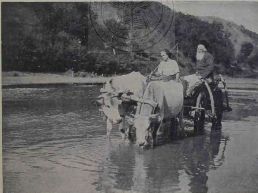
Din România; De pe valea Argeșului.

știi cum. Îți svîntă snurile ce-au asudat puțin, și le lasă așa... albe, ca doi puî de lebădă... Doamne, zău că ești proastă, Veturio! Auzi ce-i vine în gînd! Unde s'a mai pomenit așa ceva. Gheorghe are »prelegeri« azi până la 12, cum va putea veni dar' să te cuprindă de după gît, cum ai voi tu și să-și plece capul pe snul tău desvălit, să-ți audă bătăile inimii? Cum gîndești tu că va putea, cînd e așa departe, să te prindă de mijlocul tău subțire și să te strîngă la piept? Vezi că nu se poate, și totuși tremuri, și se pare că te privește de undeva. — Vezi bine că te va privi, că Gheorghe nu are altceva de lucru. Și apoi el, așa de serios cum îl știi, intrat-a vr'odată în astfel de jocuri copilărești? — Și Veturia — gîndindu-se puțin — roșește toată, și clatină din capul frumos că ba. Dar' totuși ochii pătimași vorbeau de o fericire mare. Se încheie repede la haină și sprintenă ca o căprioară, fuge la stratul ce măi era de plivit. — Soarele se ridica tot măi tare, dar umbra unui pâr mare,