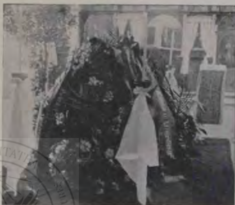
Coștiugul împodobit cu cunună.