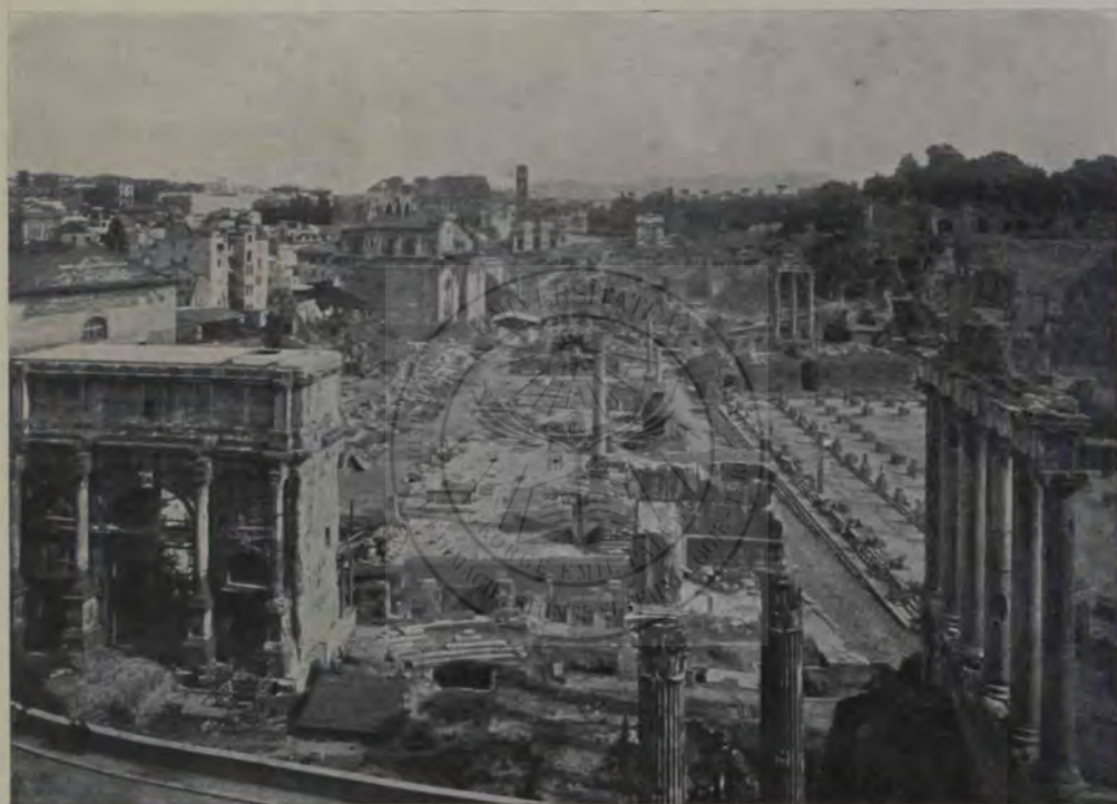
Forul roman actual, văzut dinspre Capitol. La dreapta: Templul lui Saturn; basilica Iulia (jos); templul Castorilor; mai la dreapta: templul și biblioteca lui August; mai la stânga: Casa Vestalelor cu atrium la mijloc; în fund: Palatinul. La mijloc (între cele două căi sacre): Templul lui Vespasian (coloanele în față); stăvilarul lung: Rostra; urmează piața forului (coloana din față e a lui Focas); ruinele templului lui Cezar; la capăt: arcul lui Titus (pe Velia). La stânga: arcul lui Septimiu Sever; la stânga lui, fațada Curiei (se vede frontonul); basilica Aemilia; Templul Faustinei (biserica S. Lorenzo); Templul lui Romulus; basilica lui Constantin (în dosul templului Faustinei); Templul Venerii și a Romei (San Francesca Romana, în fund); Coloseul.

cesc: bazilica. Dacă focul ce a bântuit mai târziu n'a lăsat nici o urmă din lucrarea lui Caton, avem însă rămășițe vrednice de luat aminte dela cele două mari basilici, cari stăteau față 'n față pe cele două laturi ale Forului propriu zis. Una, cea mai veche, despre mează-noapte, basilica Aemilia, se datorește familiei Emiliilor, din care a eșit un Paul Emiliu; cealaltă, mai nouă, despre mează-zi, e opera lui Iuliu Cezar dela care se și numește basilica