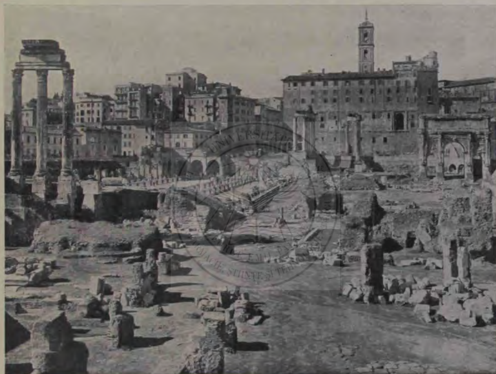
Forul roman actual cu vedere spre nord. În față: Casa Vestalelor cu atrium. Începând dela stânga: Templul lui Romulus (rotund); bazilica lui Constantin (cu 3 arcade); biserica S. Francesca Romana (=templul Venerii și Romei).

său învingător Constantin cel mare, al cărui nume și poartă. Ceeace a rămas dela ea — zidurile cu pilaștri și cu o parte din tavanul casetat și boltit — e destul spre a ne da seamă de arhitectura acestei bazilici. Boltitura semicirculară sau apsida, caracteristică acestui fel de clădire ca și bisericei noastre, care ca nume și plan e fătul ei, se vede și acum în păretele, cu care se încheie spre mează-noapte arcada dela mijloc. Ea era