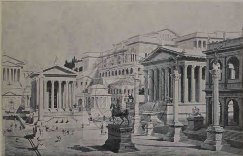
Forul roman reconstruit cu vedere spre sudost; către Palatin (începând dela dreapta): În colț bazilica Iulia; templul Castorilor; casa Vestalelor; templul vestei (rotund); templul lui Cezar; templul Venerii și Romei (spre răsărit, pe Valia). În față, piața Forului.

Dacă dela stânga templului, — unde pe Calea Sacră abia mai recunoaștem urmele arcului triumfal a lui August — ocolim pe la Fântâna Juturnei zidul temeliiilor dela templul Castorilor