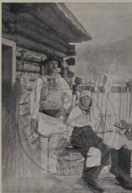
Țărani din Vama-Buzeului. (comit. Trei scaune).