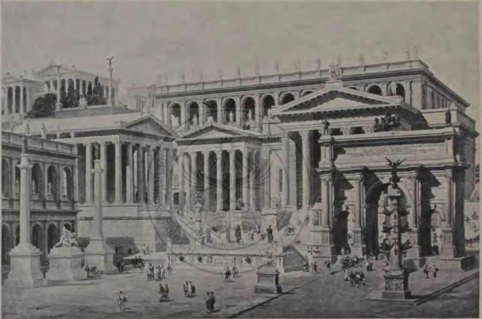
Forul roman reconstruit cu vedere către apus, spre Capitol. În rândul de jos (începând dela stânga): Colțul bazei lui Iulia; templul lui Saturn; templul lui Vespasian; templul Concordiei, arcul lui Septimiu Sever. Rândul de sus (pe Capitol): Templul lui Iupiter; Tabularium. Înainte, piața Forului cu Rostrele văzute din față.

pe o vastă poditură de piatră, ale cărei laturi mari purtau un lung portic cu coloane, în felul cum e bunăoară piața plină de măreție a sfântului Petru. Cele două abside casetate frumos cu o parte din zidurile lăturalnice de cărămidă se păstrează și acum; în ele erau puse, șezând pe tronuri, statuele colosale ale celor două zeițe. Se zice că Apolodor, genialul arhitect al lui Traian, s'ar fi împotrivit la planul lui Adrian și ar fi zis că: »dacă zeițele ar fi vrut să se