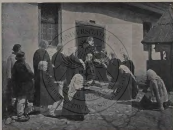
Un botez în comuna Șugag (comit. Sibiuului). (Fotogr. E. Fischer).

Câtăva vreme, badea Potecă nu mai pomenise nici o vorbă despre măritiș și leica Sultana crezuse că putuse să înduplece omul să amâie măritișul fetei pentru mai târziu. La început după ziua aceea când au stat de vorbă sub măsteacănu din băătătură, a trecut prin grele gânduri de ispită. Câteodată se gândia că rău făcuse de se împotrivi, căci putea să scape bunătațe de flăcău după cum spuneă Românul ei adesea. Altădată însă găsiă că n'are să-și bătuiască nimic căci de bună seamă flăcău-