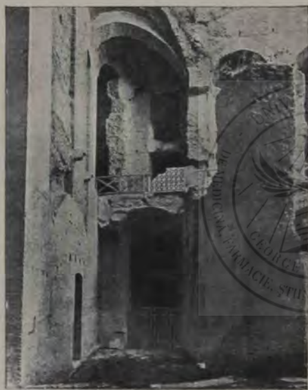
Palatinul. Ruine din substructiile palatului lui Tiberius și Caligula. Așa zisul »pod al lui Caligula«.

Smintitul acesta încoronat nu s'a mulțumit