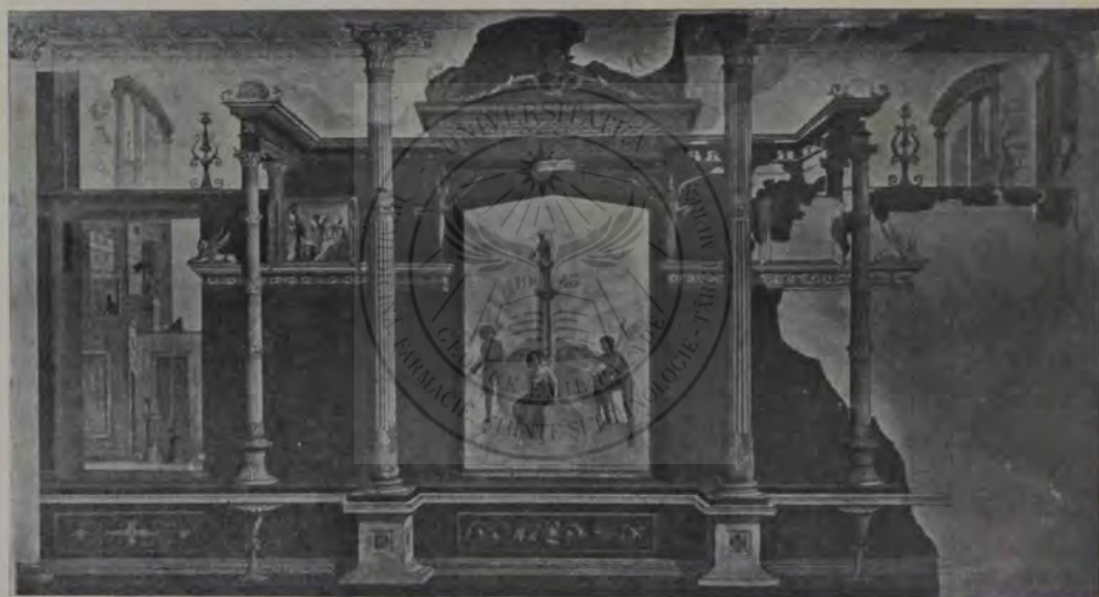
Palatinul. «Io supt paza lui Argus pândit de Mercur», frescul din «Casa Liviei».

tăiate în piatră dela «scara lui Cacus», care și acum duce spre platou din valea «Marrana» ce desparte Aventinul de Palatin, se văd temelile unui zid străvechiu ce amintește felul de a clădi al Etruscilor imitat de Romani: sunt blocuri mari prismatice de piatră moale, așezate unul deasupra altuia, fără ciment și pe rând, când dealungul, când dealatul. Tradiția spune, că coliba lui Faustulus se află la marginea de sus a scării lui Cacus, uriașul căzut jertfă lui Hercule. Vechimea acestor ziduri ne face să le punem în