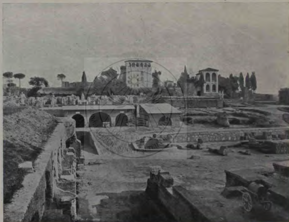
Palatinul (vedere despre Apus). La stânga, în față, ruine despre sud ale palatului lui Tiberiu; apoi »Casa Liviei« (cu trei odăi deschise spre nord; la mijloc »tablinul«); după ea ruinele palatului lui August. În fund vila Mills cu grădina ei. La stânga (după cea dintâi ruină) restul »Colizei lui Romul«.

dafiri ai grădinei »Casinului Farnese«. De aici, în adevăr, ai o privire din cele mai frumoase asupra părților orașului, pomenite de marele orator. Nenorocita-i vecinătate însă nu l'a lăsat să guste liniștit farmecul acestei priveliști. Pe vremea zilelor de răstriște suferite de el în surgun, Clodius a hotărât poporul să decreteze dărâmarea casei lui și înlocuirea ei printr'un templu al Minervei. Dar Ciceron n'a rămas nemângăiat,