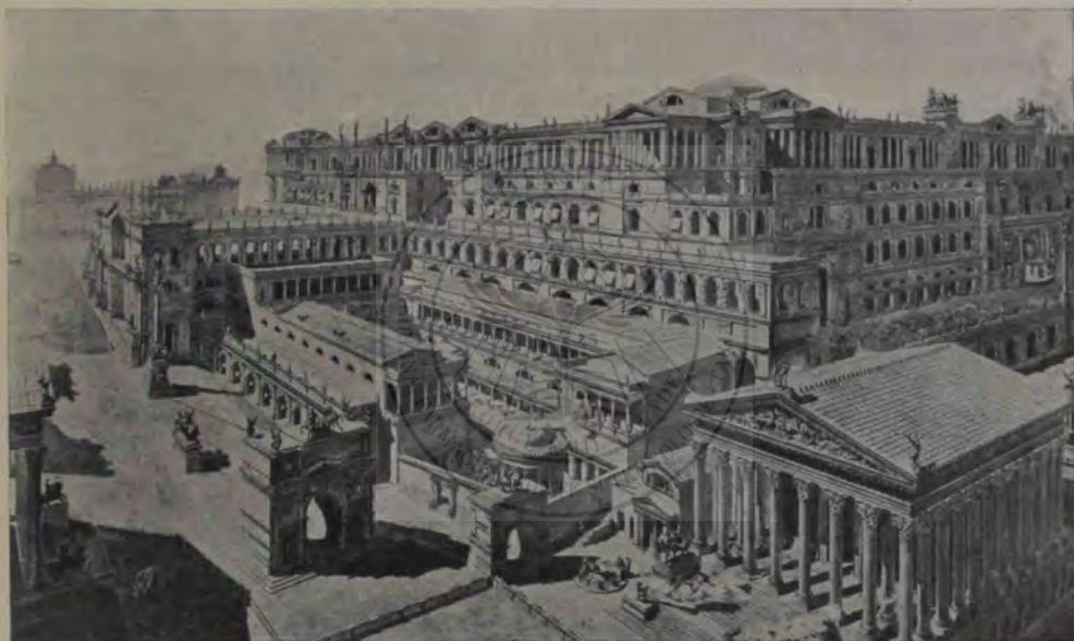
Palatinul. Palatul reconstruit al lui Tiberiu și Caligula, văzut despre mează-noapte, din Forul Roman (în față la stânga templul Castorilor; la dreapta Casa Vestalelor și templul rotund al Vestei).

nal, din fața despre meazănoapte a Palatinului, și apoi cu veneticii Etrusci. În vremea asta femeia împacă pe Romani cu Sabinii, și, pentru mulțumirea amânduror părților, scaunul domniei sau centrul puterii politice nu mai e pe Palatin, nici pe Quirinal, ci în valea dela mijloc, în Forul Roman și pe Capitol. Urmează lungile veacuri ale republicei, în care »Roma quadrata«, încetul cu încetul, atrage highelitelul capitalei și devine cartierul aristocrației — un fel de city a cetății; negreșit, nu întâmplător, ci printr'un instinct firesc sprijinit de gândul pururea viu,