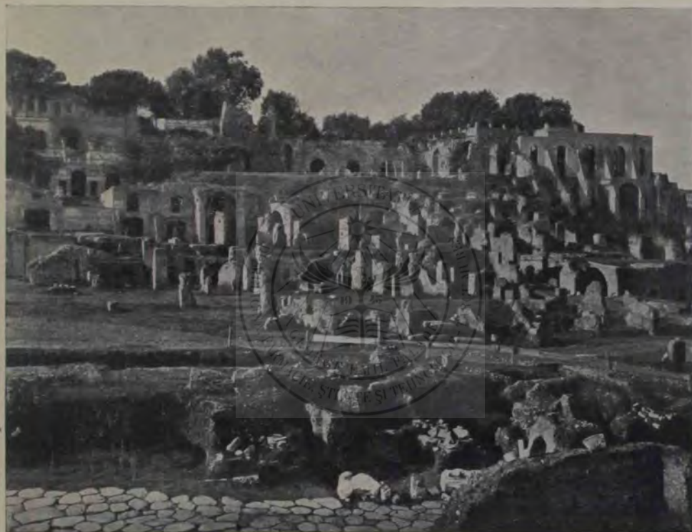
Palatinul: Vedere despre nord, din Forul Roman. La stânga Casino Farnese; la dreapta grădina vilei și terasa cu ruinele palatului lui Tiberiu și Caligula (unde a fost casa lui Cicero).

podobise porticul cu patru coloane de »marmură din Hymettos«. Dar de acum în lux boerii Romani se puteau asemăna cu satrapii din Orient; materialul solid, cu care își clădeau casele, lucrările de artă mare, decorativă sau industrială, cu care și le înfrumșeau, îi costau în adevăr sume de necrezut. Dar unde sunt urmele lor? Inlocuirea regimului democratic cu cel monarhic le-a fost fatală; căci în locul caselor particulare