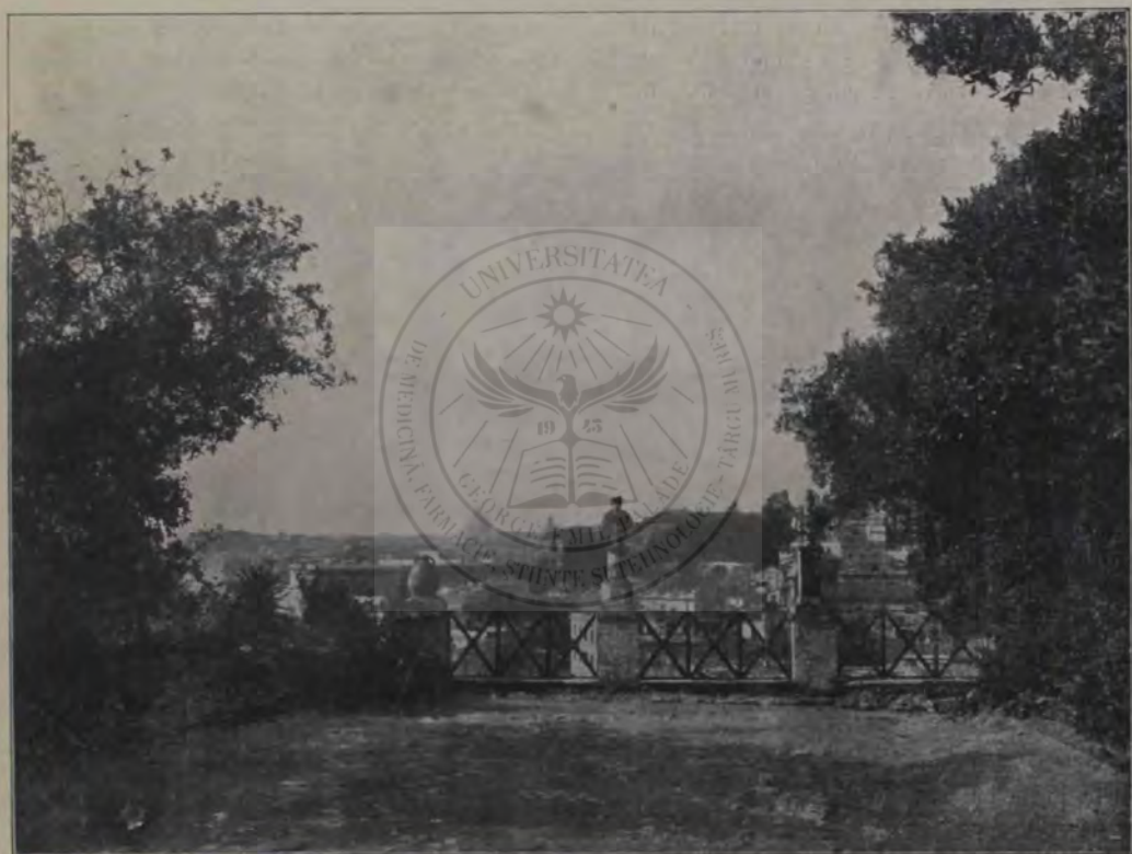
Palatinul (vedere de pe colțul nordic). Locul casei lui Ciceron, înlocuit mai târziu de palatul lui Tiberiu. În fund se vede cupola Sf.-lui Petru.

zidul, cu care neamul cavalerilor Frangipani pe vremea cruciadelor au încunjurat colina, unde uneori înșiși Papii amenințați de primejdiile de afară și-au găsit un adăpost sigur. De atunci Palatinul ca și alte locașuri de ruini antice, devine o carieră de material de zidit, din care s'au ridicat atâtea turnuri și întăriri, atâtea biserică și palate. O nenorocire și mai mare a fost, că sute și sute de ani cuptoarele insta-