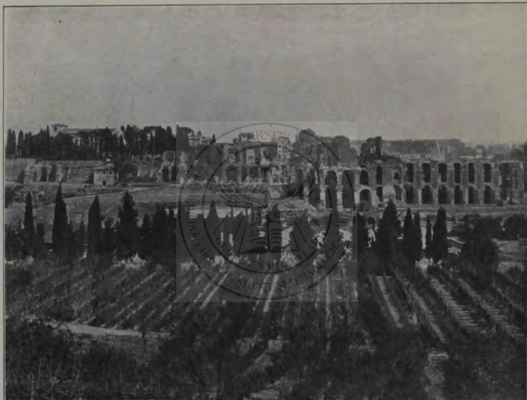
Palatinul. Vedere de pe Aventin. Valea ocupată de Circus Maximus. La stânga, Vila Mills între chiparoși, la dreapta ruinele palatului lui Septimiu Sever.

Palatinul i se va părea pe fața pământului întocmai ca o insulă strălucitoare închegată din nestimate în mijlocul oceanului. Dacă, după Septimiu Sever, s'a clădit prea puțin pe această colină, lungul șir de împărați ce au urmat după aceea nu s'au mărginit cu ce moșteniseră: ei s'au întrecut care de care să înfrumseteze reședința lor și să strângă în ea cât se poate mai multe comori de artă și bogăție. Până unde a