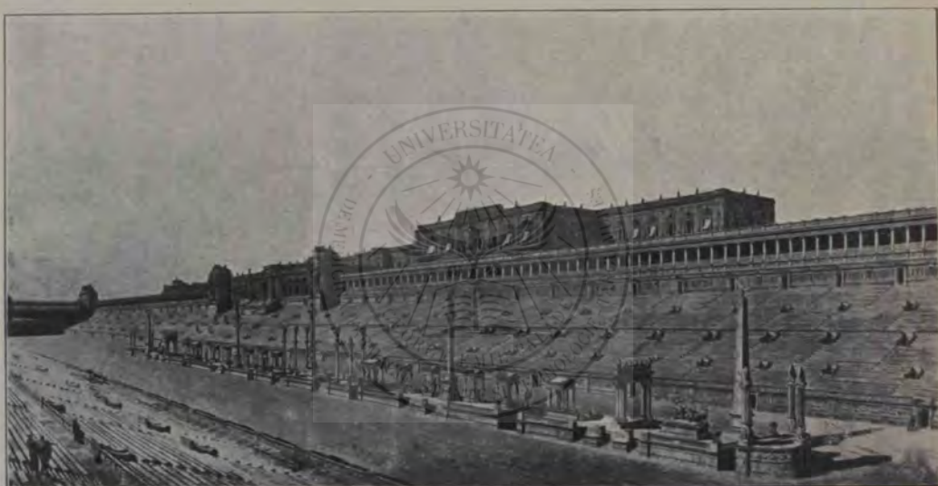
Palatinul. Circus Maximus cu latura despre Palatin (reconstruire).

fățișază minții ca tot atâtea ghicitori nedeslegate, precum se întâmplă acum câteva zecimi de ani; cadavrul atâtor măreții a fost disecat de sapa omului de știință și a fost cercetat până în adâncul măruntaelor. Pietrele multe au vorbit și au dat răspuns la cele mai multe întrebări. Toate aceste bogate și venerabile documente lapidare sunt astăzi tot atâtea icoane vii, cari ilustrează istoria literară de multeori palidă și plină de goluri ce ne-au transmis-o cei vechi. Cunoșcătorul vechimii nu mai este aici străin, ci trăiește într'un locaș cunoscut printre umbrele-i dragi, inchipuite sau visate în 'atâtea rânduri de dânsul.