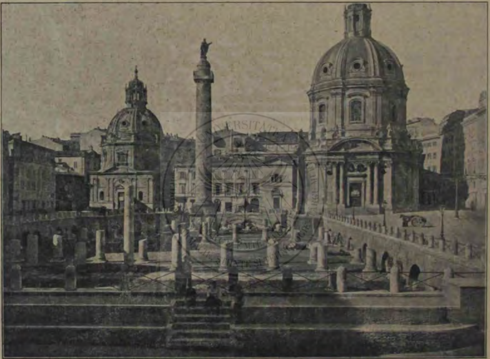
Forul lui Traian (starea de astăzi).

La dreapta dela Forul lui August, adevă spre