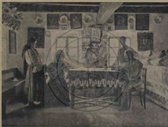
Interior de casă din Pianul de sus (comit. Sibiu).

nainte cu patru ani. Nici acum nu știu tot, — poate numai ceva. Dar atâta e destul spre a-l prețui cu mult mai tare decât înainte. Cunoști organismul, cunoști legi, descoperi desfășurarea boalelor, examinezi țesături, și din toate ajungi la convingerea, că știința numai de aceea e dată ca să te faci mai desăvârșit și să ajuți unde poți. Eu, de pildă, când am la clinică un bolnav, poate nici nu-l văd pe el, ci numai boala lui, și n'am nici o dorință să știu cine-i și de unde-i, ci vreau numai să-l ajut, — oricine ar fi. Și uite, măi, ce eră să vă spun: tot ce vedem și cunoaștem noi există de veacuri. Noi cercetăm și descoperim câte ceva ce de mult îi așezat și își are rostul său în cursul firii. Dacă ne-am îndestuli, cum zice profesorul nostru de ana-