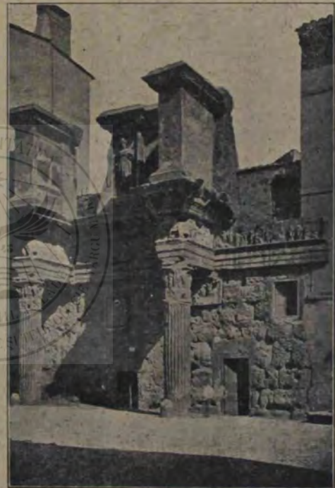
Forul «transitorium» sau al lui Nerva: «Colonnacce» cu restul zidului încunjurator.

dire a căzut pradă focului venit din trăznet sau după vr'un cutremur de pământ.