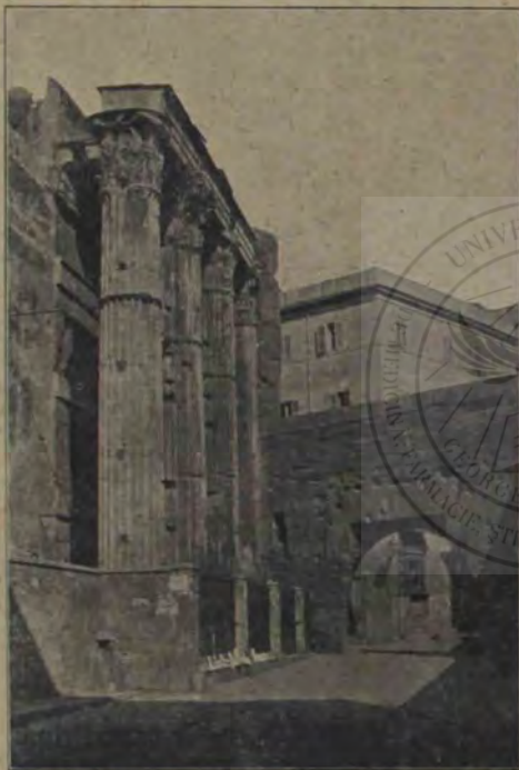
Forul lui August: Templul lui Mars Ultor și zidul încunjurator cu «Arcu dei Pantani».

gurat după moartea sa de cătră Nerva, din care pricină el a și purtat numele acestuia. Dacă lucrarea lui Vespasian a dispărut de timpuriu, Forul lui Nerva ne păstrează până azi o surpriză nu tocmai obișnuită între ruinele romane. La încrucișarea celor două strade, Via della Croce bianca și Via Alessandrina se înalță, în parte îngropate în pământ, așa zisele Colonnacce, rămășițele părții dela răsărit a zidului ce încunjură acest for: sunt două coloane corintiene, cari sprijinesc un grindis de mar-