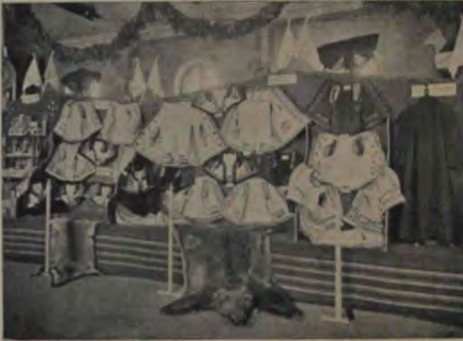
Expoziția meseriașilor din Blaj: Secția Cojocăritului și blănăritului.