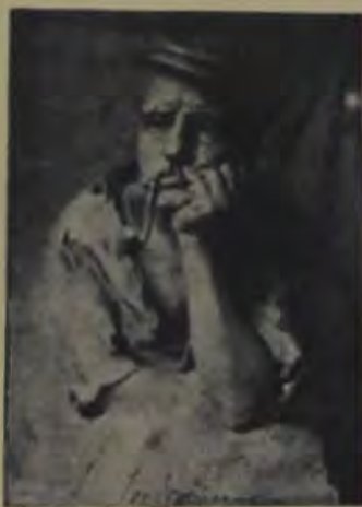
I. Iordănescu, Grija de mâine.

În seara de 8 August n. a avut loc concertul. Corul teologilor din Gherla a cântat mulțumitor „Hora” lui G. Dima și „Răsunetul Ardealului” de I. Vidu. Unele părți