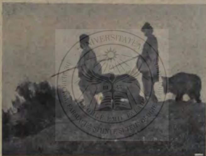
Șt. Luchian, Ursarii.

Astăzi avem domni prea mulți, Nu mai știi de cari s'ascuți. Domni de ai cari nu muncesc Fără numai se sfădesc