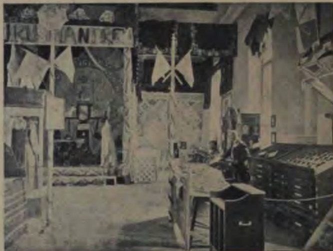
Expoziția meseriașilor din Blaj: Tipografia arhiepiscopiei și secția industriei casnice.

copacilor îl poartă, tot mai sus și mai sus, din vârf în vârf, până sus la movilă, până sus chiar pe culme, și mai sus încă până pe vârful cel mai înalt; acolo s'aplecă Synnöve spre el și-i zicea plângând: Să fi vorbit! Ea plângea cu amar și-i spunea că bine a văzut cum îi ținea Knut veșnic calea și cum, la urmă, a trebuit să-l ia. Și-l netezia cu mâna ușoară pe o parte, de i se încălzi locul și plânse atâta, de i se udă cămașa în dreptul acela. Iar sus pe o piatră ascuțită sta Aslak cocoșat și da foc la crestele copacilor de pocneau și trosneau, iar el râdea și strigă: „Nu dau eu foc ci maică-mea”, iar tatăl său Sämund sta de altă parte și aruncă saci cu grâu în văzduh, atât de sus încât nourii îi trăgeau la ei și risipeau de acolo grâul ca o ceață; și i se părea așa a minune, cum se putea risipi grâul peste tot cerul. Și când se uită la Sämund, îl vedea mic-mic, tot mai mic de abia se mai zărea dela pământ și totuși aruncă mereu la saci în văzduh, tot mai sus și zicea: „fă și tu după mine, fiule”.