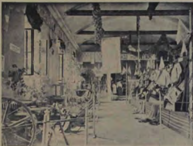
Expoziția meșterilor din Blaj: Industria agricolă și cofocăritul.