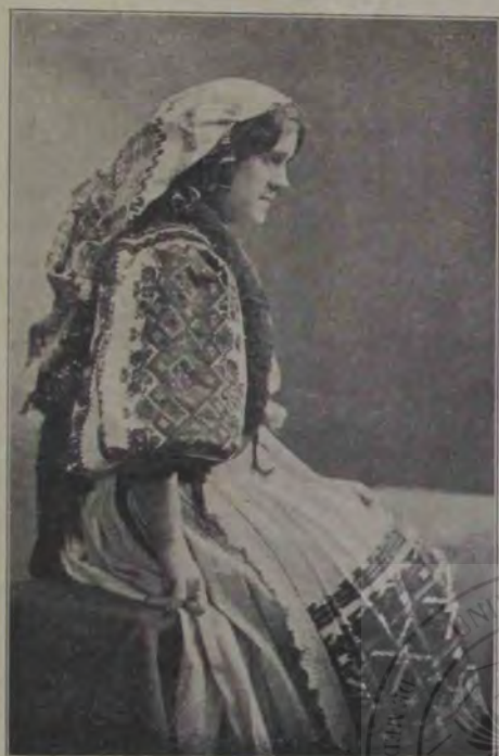
Balul din Sibiiu: Port din Boroșineu (d-ra T. Bogdan).