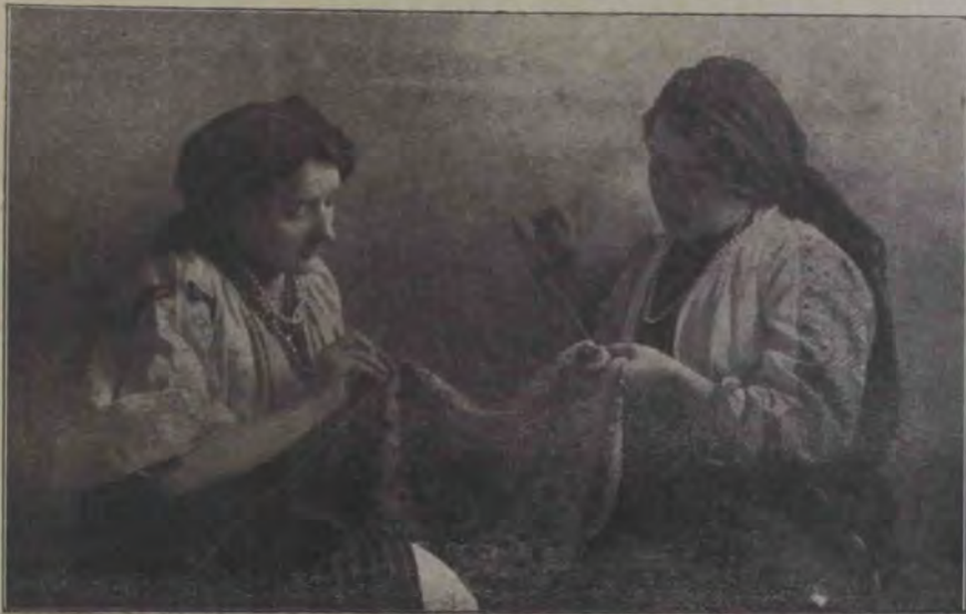
Balul din Arad: Port, din Giurgeu și de pădureancă.

mes poalele în brâu și, acuma ce să facă dacă s'a gospodărit? — trebuiă să-și hrănească vita.