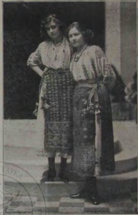
Balul din Arad: Două frumuseți.

Vulpea tot miloasă, ori cum să-i zici, ori poate numai ca să se fălească pela vecine, căl-a dus în car pe vestitul de lup — dânsa va ști, că eu nu-s chiar popă să le știu toate, — oprește caru'n loc.