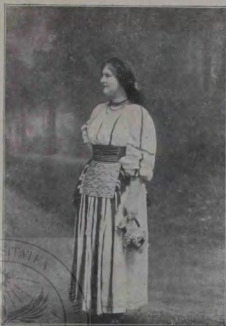
Balul din Sibiiu: Port din Bănat (d-ra Vescan).

Vremea trece, așa mai cu supărări, mai cu tânguieli, dar vulpii nu-i mai iasă din cap carul ei și boii ei.