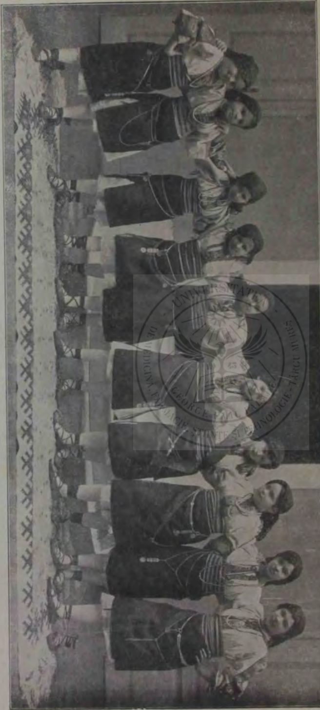
Batalul din Arad: Grupul copiilor cari au jucat la matineu in porti de padurence.

nime, cine să-mi păzească oile, Dumnezeu îi deasupra și nu s'or prăpădi ele în pădurile astea, că doar nu-s păgân să mă treacă sfânta slujbă.