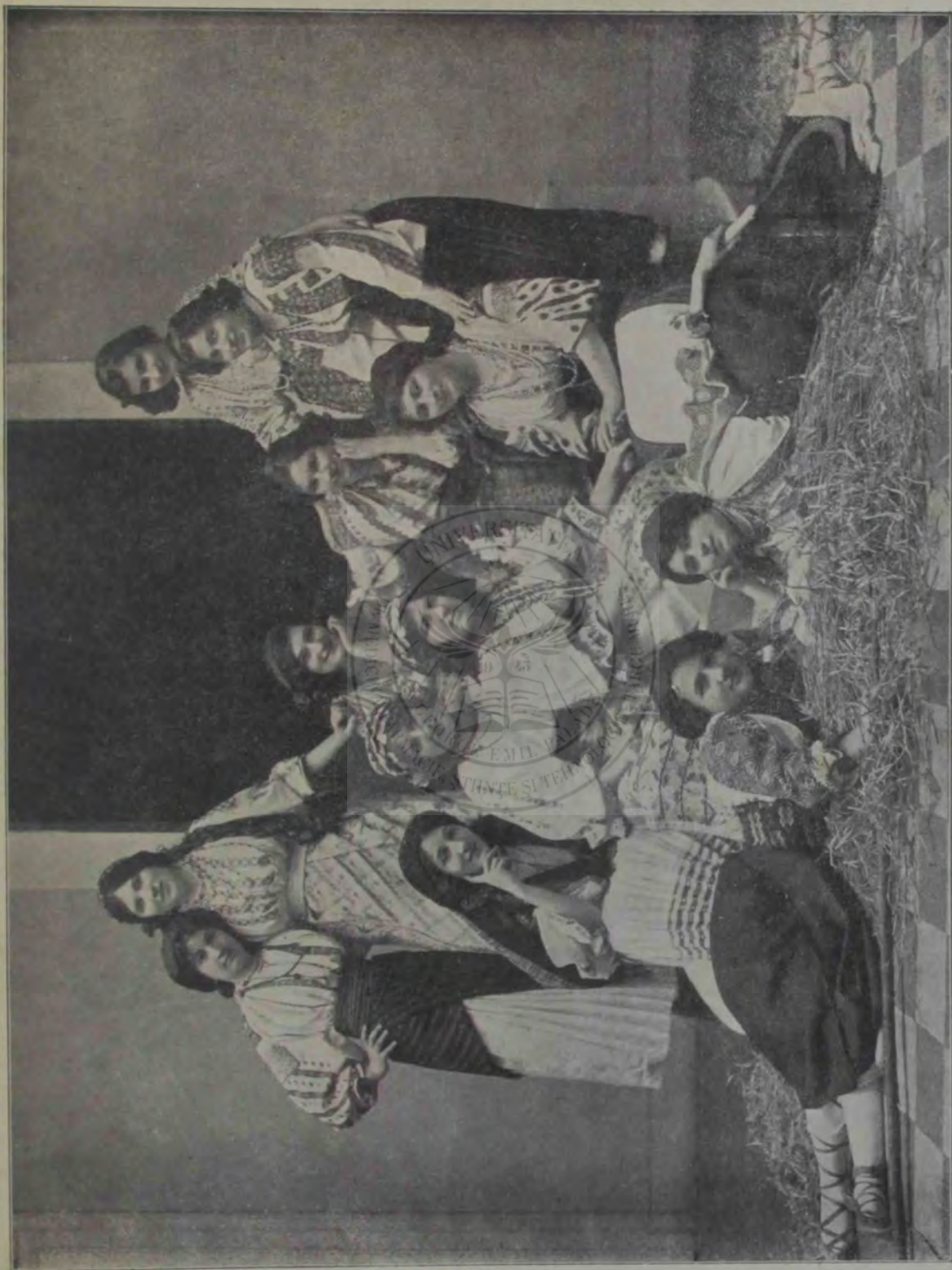
Balul din Arad: Un grup de dansatoare.