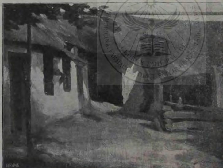
N. Mantu: În ogradă.