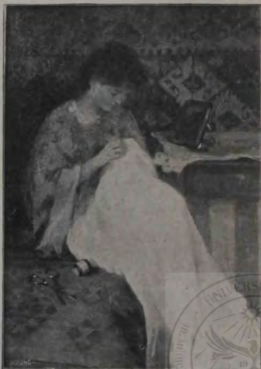
Ip. Strâmbu: Femeie cosând.

— dar eu par'că totuș aveam o presimțire că lucrurile n'aveau să ia o întorsătură tocmai așa de tragică. Nu-mi puteam cu nici un preț închipui pe omul pe care adineaori îl văzusem bălăbănindu-se agale pe-aici pe dinaintea ferestrei mele, în ipostaza de victimă, de martir al datoriei.