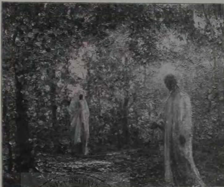
A. G. Verona: Hristos și Samariteanca.

Apoi, deodată, se simți în odae un sgomot ciudat, friguros ca și când două aripi mari, nevăzute ar fi fâlfâit de mai mulțori. În clipa aceea bolnavul își îndreptă și piciorul cel îndoit, se întinse din răsputeri, suspină lung și ușurat, întoarse ochii cu albul în sus și pe urmă rămase neclintit. După un dram de vreme însă corpul totuș se mai smuci o leacă, mânilor se adânciră mai grele în așternut, iar