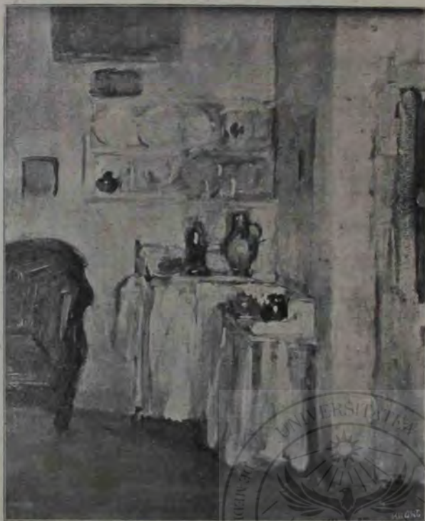
E. Popa: Interior.