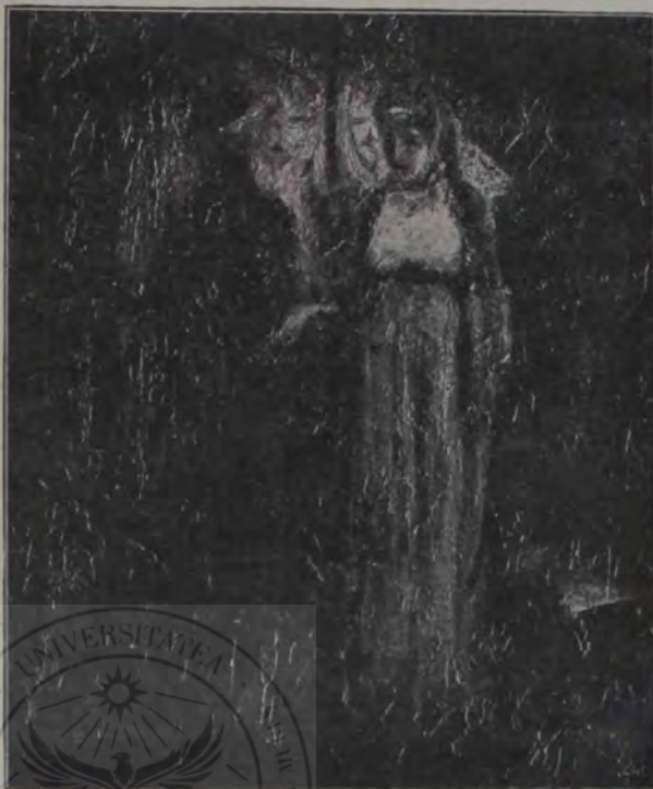
P. Căpitan; Ovreica din Salonic.