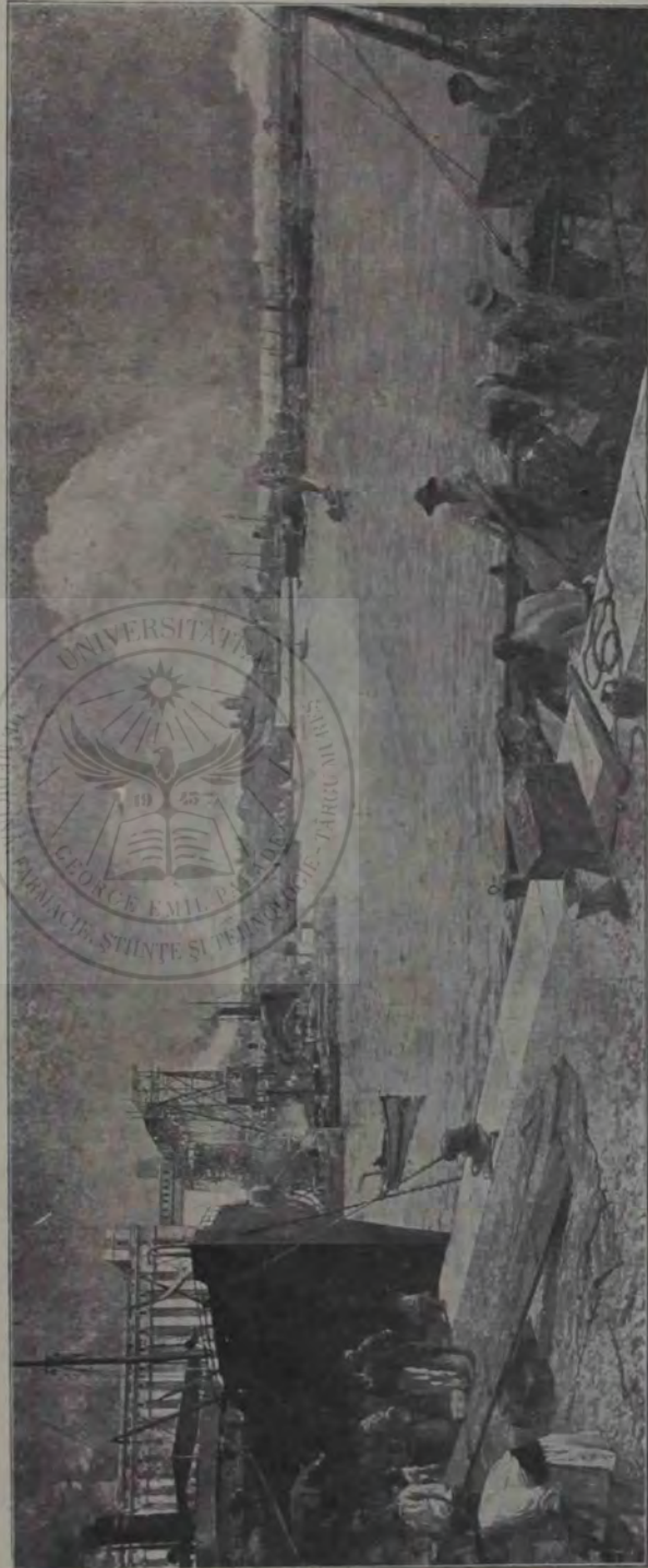
N. Vermont: Portul Constanța.