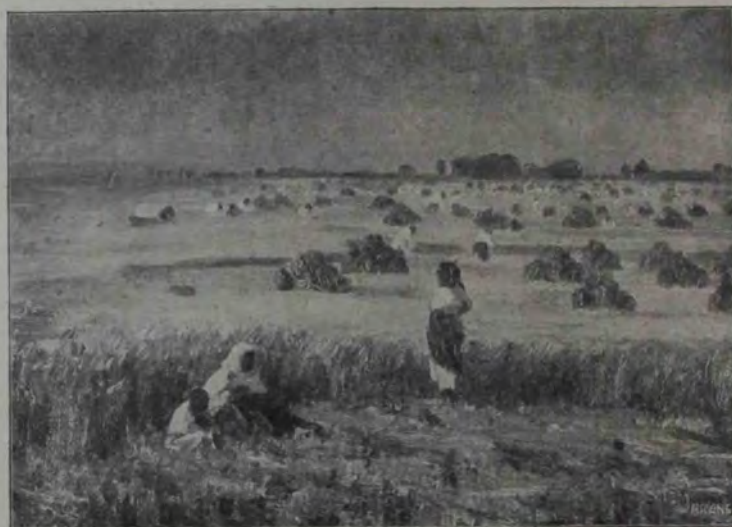
St. Popescu: La secerat.