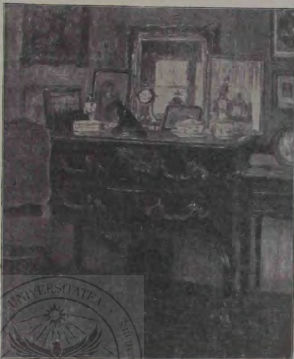
G. Mărculescu: Interior.

La groapă, cioclii așezară cosciugul pe dâmbul de lut umed, iar popa începă din nou să cetească. Stropi sicriul cu aghiazmă, stropi și mulțimea, bălălăi de câteva ori cu cădelnița, mormăind ceva printre dinți și pe urmă se dădū trei pași înapoi. Groparii vârfiră două