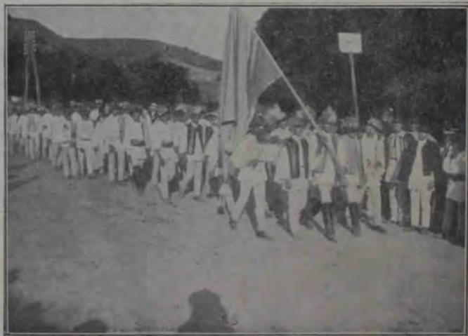
Conductul etnografic: Sâncelenii.

să visez. După amiaza, ca în totdeauna când am prilejul să pot fi singur, înseninat pe nesimțite de pacea ce plutia în jurul meu, mă dădusem la „dulci nimicuri” — cum le numește poetul: — răsfoisem cărți, ziare vechi; pusesem în rame eu singur, chipurile lui Beethoven și Lenau; răscolisem multă vreme prin sertare unele scrisori; atacasem la pian începutul „melancolicului „Impromptu” de Schubert... În odaie stăpâniă o tăcere nespuse de dulce, încălzită de dogoarea molcomă, abia simțită, a sobei. Prin perdelele groase, pătrundeă înăuntru o lumină slabă cenușie, ce se răriă cu atât mai mult cu cât se depărtă de ferești, lăsând colturile odăii într’un fel de umbră subțire, prietenoasă, odihnitoare. După un timp, sub un fel de beție a simțurilor, am luat pe Eminescu;