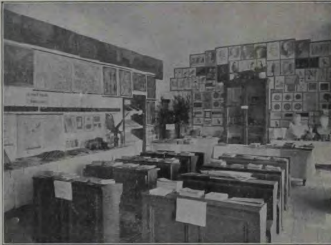
Expoziția din Blaj: Secția școlară.

de grijitor, ca mâne, în șanț, lângă drum te-ai sfârși. În șanț!