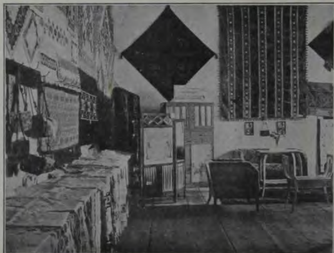
Expoziția Doamnelor și Domnișoarelor din Blaj.