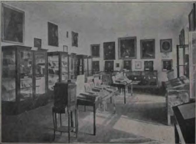
Expoziția din Blaj: Secția istorică culturală.

Cum mergeau așa, în fața lor, nu departe pe cărarea netedă, se apropiă o femeie