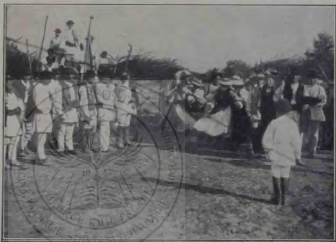
Serbările din Blaj: Petrecerea țărănească.

terincei. Mi-am adus apoi aminte de-o seară de toamnă, în care am auzit cântecul acesta, de mult...; mi-a răsărit atunci deodată în minte un chip zimbitor de fecioară, și-am început să plâng cu hohote... O, chipul ei!... Pare că-l văd: un trup înalt, svelt și cărnos; o față cu obraji rumeni, cu buzele rumene; cu ochii negri, cu sprâncenele negre, cu părul negru, — o față sglobie, cu râsul sgomotos, clocotitor — o lucrătoare într'un atelier de „mode”, — cea dintâi dragoste a mea, răsărită într'un amurg de primăvară, și apusă prin plecarea mea, într'o dupăamiază de toamnă, în liniștea orașelului acestuia. De ce-am uitat-o? Cum am putut să-i nesocotesc iubirea? Cum de s'a stins dragostea aceasta, fără să fi lăsat măcar o urmă, ceva care să-i sfințească amintirea de-alungul vremii ce ne îmbătrânește trupurile, ne pustiește atât