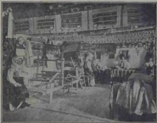
Expoziția din Blaj: Industria țărănească.