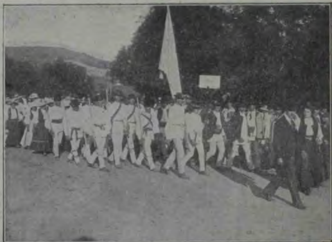
Conductul etnografic: Mibălteni.

Întâmplarea, dupăcum vei vedea și tu, e — socot — foarte puțin „curioasă”, mai ales pentru tine care îmi cunoști atât de bine firea și apucăturile. Pe aici, tuturor cărora mă ’ntrebă de dansa, le spun în felurile chipuri, căutând să răsluiesc cât mai mult din adevărul asupra acestui „caz”. Tie însă n’am pentruce să-ți ascund nimica. Ba încă voiu căută să-ți fac cunoscut despre mine unele lucruri pe cari, fără ’ndoială nu le vei fi știind, dată fiind depărtarea ce ne-a înstrăinat și vremea îndelungată de când nu ne-am mai văzut.