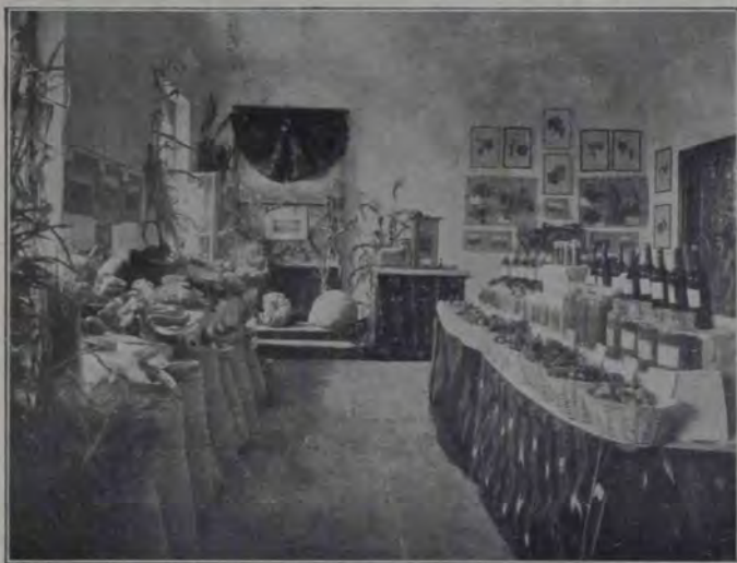
Expoziția din Blaj. Secția silviculturii și agriculturii.

„Am făcut-o bună!... Să se bucure câinii, ciorile și dihaniile!