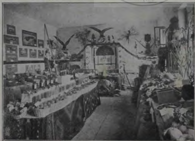
Expoziția din Blaj: Secția silviculturii și agriculturii.

Apucară în sus și merseră tot prin inimă de pădure. Și, cum se strecorau în codru, la un vârf pietros, brazii se rârîră. Călătorii se opriră