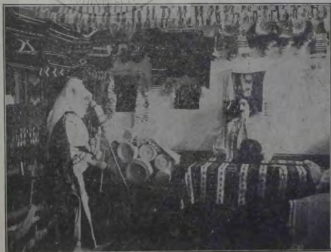
Expoziția din Blaj: Casă de pe Săcaș.

Ciocărlia își văzù de copilași. — Cănele se tolăni pe mușchiul de lângă scorbura lui,