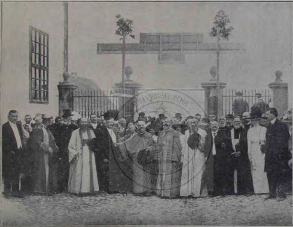
Serbările din Blaj: Arhierii Români la deschiderea expoziției.

adresa serbărilor din Blaj, credem că nu va surprinde pe nimeni. Ei, cari s'au obișnuit să ne creadă un popor de iloți și de agitatori, s'au speriat, când au văzut aurul curat al sufletului românesc manifestându-se cu atâta putere. În ura lor sălbatică au sunat trâmbițele de alarmă și ne-au acoperit cu