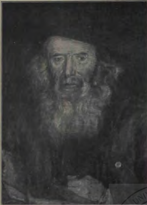
M. Pop: Cap de studiu.