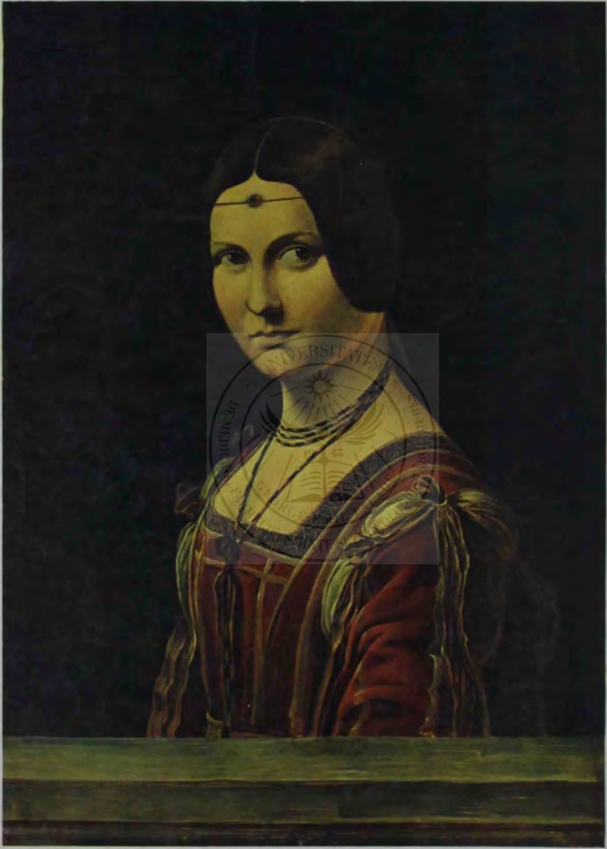
Lionardo da Vinci: La belle Féronnière