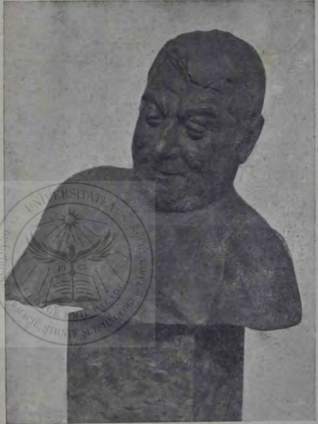
O. Spaethe: Silen.

Să vedem ce zice a cum în această chestie viceprezidentul reuniunii. Iată însaș lucrarea d-lui Pocola, care a fost primită de adunare,