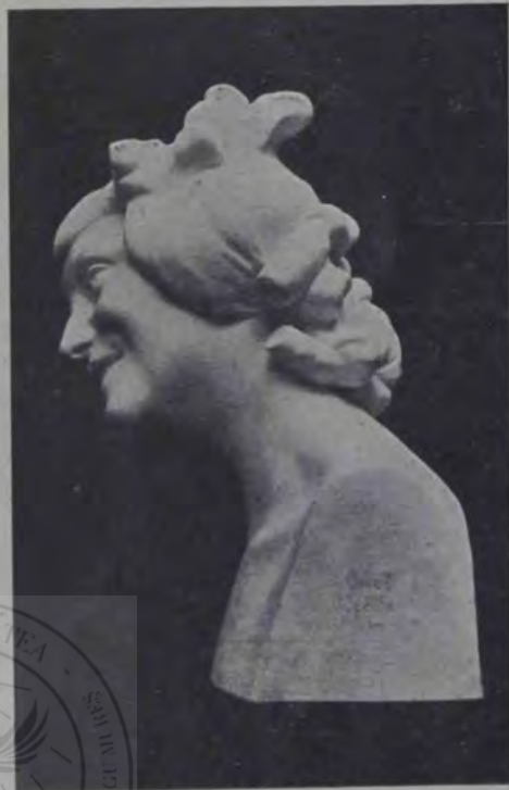
O. Spaethe : Bachantă.

măreață. Și ce trup: prelung, rotund și alb câ fulgul de zăpadă. Numai fruntea i-a stro- pit-o câțiva scârlionți, negri corb — părea că-s tăuni — d'ăia și copiii l-au botezat Tăunu.