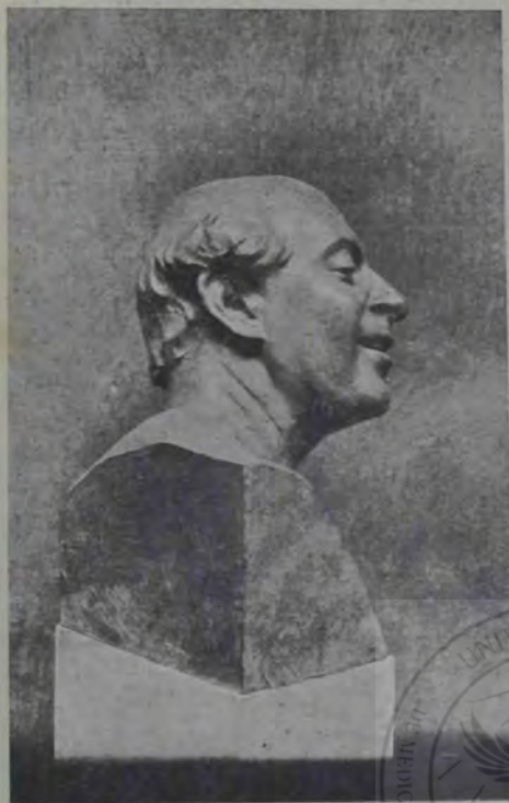
O. Spaethe : Satyr.