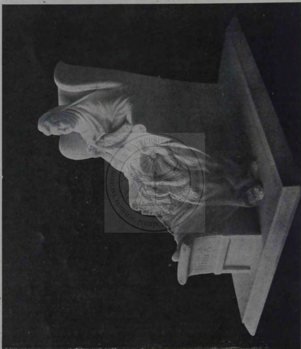
O. Spaethe: Carmen Sylva.

de scârlionții de pe frunte, se așezau amândoi mineața în frunte, cu pasul măsurat și legăcap în cap și se luptau; se făcea, că fugenându-și trupul pe șoldurile pline. Altfel