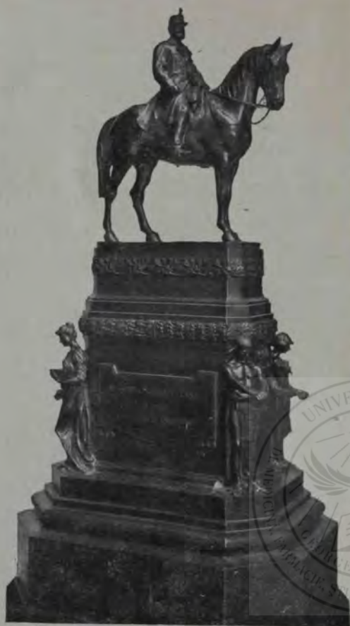
O. Spaethe: Statuia Regelui Carol.

cu ceară. Odată au stat doi băieți o jumătate de zi cocoțați într'un stejar; iar taurul da ocol pe la rădăcina copacului și svârleă din picioare. Noroc, că l-a prins setea pe Tăunu și a coborât devala la izvoare. Numai așa au scăpat băieții cu fuga.