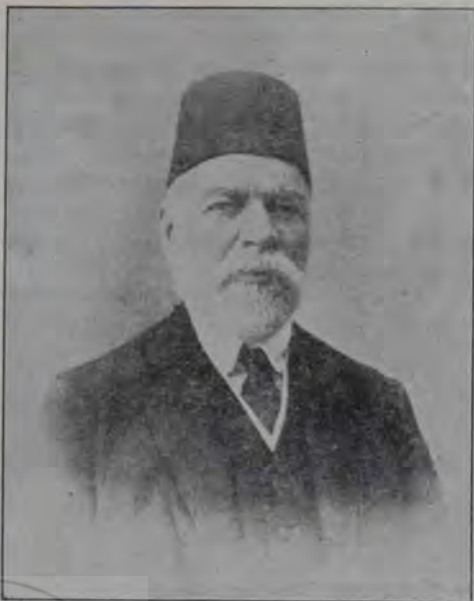
Șeful Albanezilor Beiu Ismail Kemal, sub conducerea căruia s'a proclamat în 23 Noembrie independența Albaniei.

Sfatul ușurel al berzelor tăcu. Cocostârcul își întinse aripile și se desprinsese lin de lângă cuib; pluti ca o umbră prin amurgul fumuriu și fetița ridică ochii spre el. Lipsi o vreme, apoi se întoarse, pe când seara umplea livada de taină, se roti deasupra șurei și se lăsa la cuib lângă baba lui. Amândouă pa-