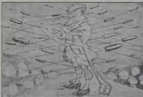
Correspondentul de războiu englez (caricatură).

Ele se cufundară în amintirile anilor de școală. Își aduceau aminte de profesoare, de bone, de colege. Din când în când vr'una se miră: cealaltă spuneă de o colegă care a murit. Ele își avuseră paturile vecine în