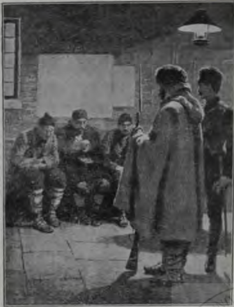
Prizonieri Turci păziți de Bulgari.

tinatul. Dar de-acum simția că-i iartă, că nu le mai dorește nici rău nici bine — că pentru ea nu mai există. Simția, c'o sfâșietoare durere fizică, cum vieața ei se adună, se concentrează într'o singură dorință. Și aceasta nu eră o micșorare, nu-i strimță vieața. Dorința aceea, ună singură, îi arată vieața mai plină, mai largă, nemărginită. Și vieața se contopia acum cu bucuria, cu deliciul, cu fericirea care nu se va mai sfârși niciodată. În alergarea trenului, aici pe catifeaua verde, ar fi dorit să stringă în brațele sale lumea întreagă, să-i ierte pe toți, să-i iubească. O milă nesfârșită îi umplu sufletul.