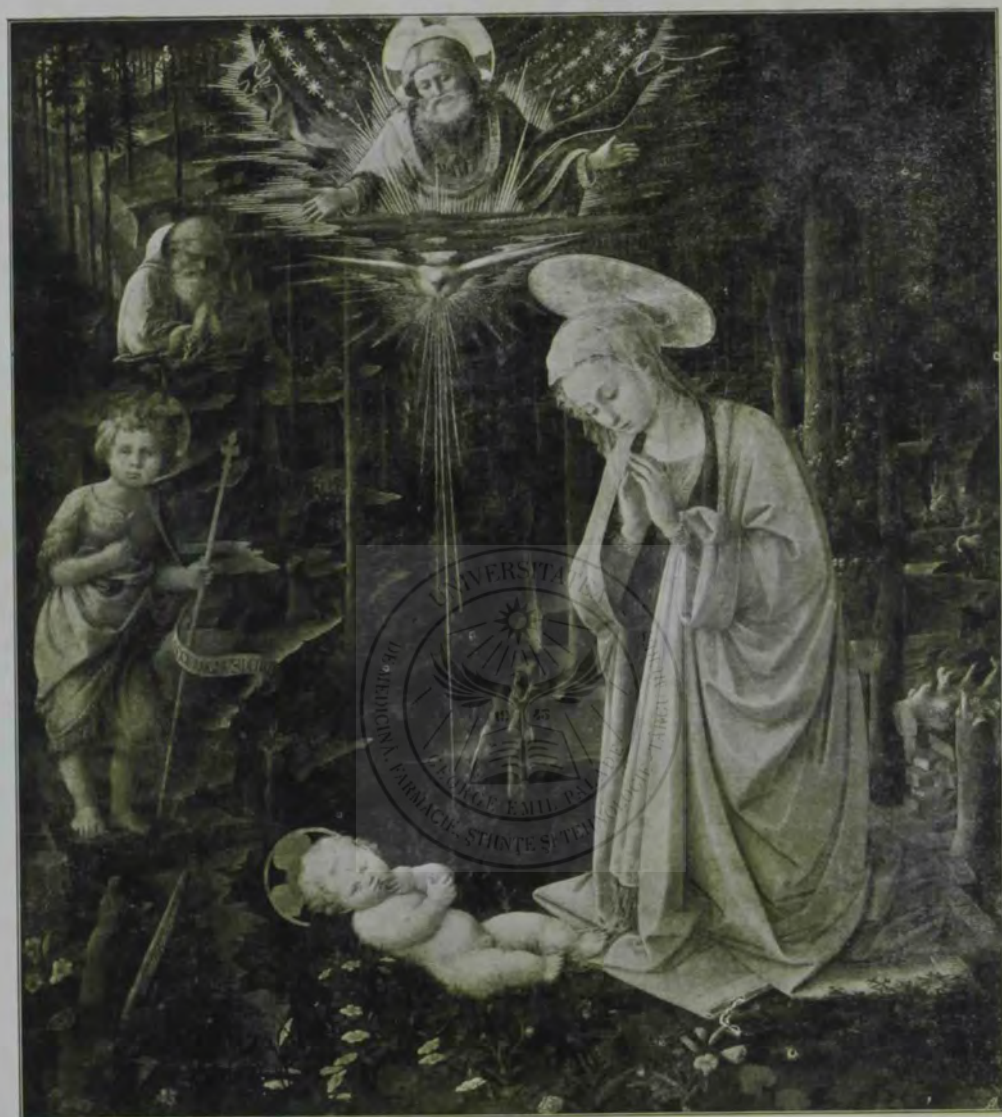
FRA FILIPPO LIPPI: NAȘTEREA LUI HRISTOS.