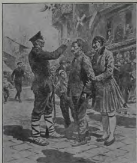
Ocuparea Salonului: Un soldat bulgar și grec făcând cruce pe fesul unui soldat Turc.

și se întorcea seara. În ograda oamenii umblau încet după treabă. În livada întinsă intrase o pace adâncă și arborii stăteau în soare ca într'un straiu de spumă de argint! În liniștea, care o împresură, Anișoara stă singură la fereastra deschisă și se gândea, se gândea cu întristare la măicuța moartă. Asta eră mai ales în amurg, după luminile și bucuriile zilei, când toate tac.