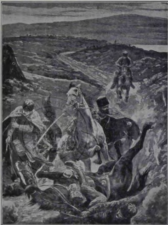
Războiul din Balcani: Muctar Pașa rănit într'o recunoaștere a forturilor dela Ciataldgea.

sgomot enorm. Pisoii s'a trezit și el de undeva de sub vatră, atașându-se cu toată nervositatea rasei la concert. Săreă nebun pe păreți, miorlând în mezzo-sopran. Câni hăuleau și ei pe aproape și prin depărtări, în întreg satul.