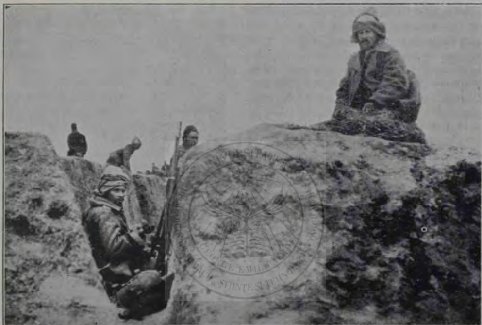
Soldați Turci în întăriturile dela Ciataldgea.

În seara aceea pădurarul veni mai de vreme ca de obicei. Eră mâniaș și izbiă porțile cu sunet mare.