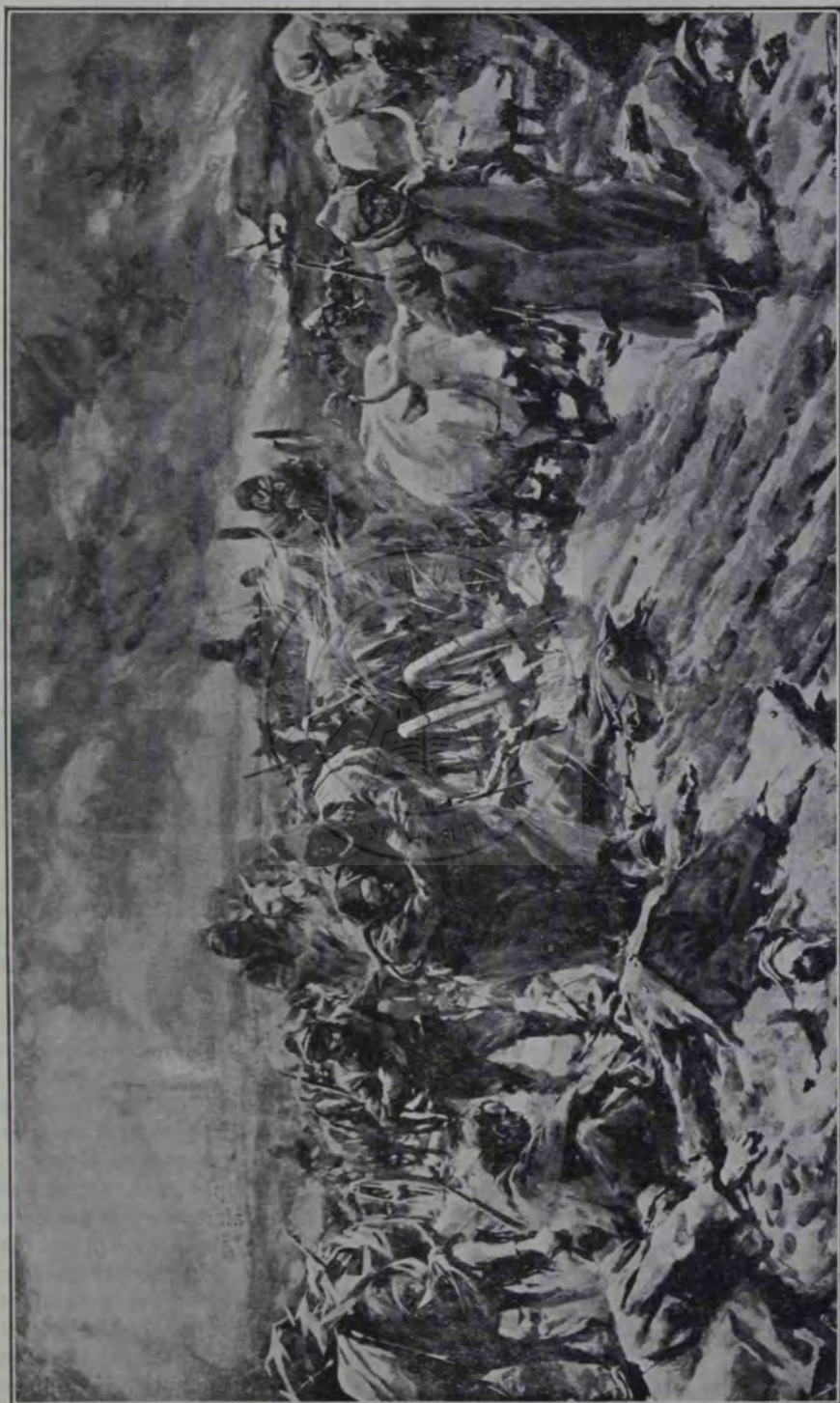
Războiul din Balcani: Retragerea Turcilor după lupta de la Lule-Burgas.