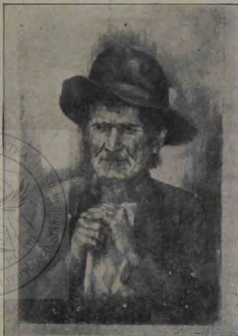
Const. G. Mihăilescu: Schiță (cârbune).

Apoi, ca culminare a realizărilor globului ceresc, urmează, tot în mod succesiv, adecă odată cu desfășurarea sentimentului poetului, desfășurarea dinamică a puterii Lunei. Intrarea în această fază nu este făcută brusc, poetul ne introduce întâi „tremurarea pe ape ușor“, scuturarea „în orice ascuns labirint“ a „dulcelui parfum de verbine“, aducerea la răscuri a fantomelor nopții, pentru ca să ni se dea drept culminare a poeziei, această desfășurare în spațiu și timp, puternică, cu totul puternică, unde concepția metafizică a poetului, exteriorizată prin vorbire, nu numai că îndeplinește toate legile de reproducere-