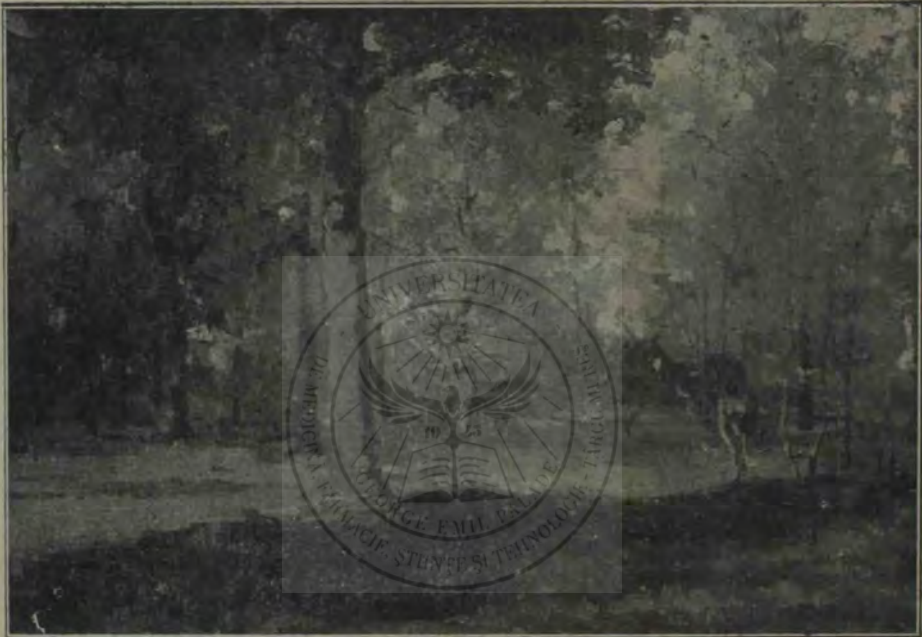
D. Mihailescu: Peisagiu.

Înainte vreme, satul acesta a avut un munte întreg de unde ori și care locuitor putea să taie brazi și să-i vânză. Această proprietate comună, sau de vâlmășie, cum îi zic ei, au pierdut-o căci a fost cumpărată de Christache