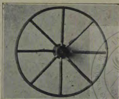
Cârma (de lemn) a aeroplanului.

Ce drăguță eră jucăria aceasta! Aveam impresia, că văd aeroplanul lui Vlaicu, ridicat la o sută-două de metri, planând în văzduh, ca o elegantă libelulă. Sugestia eră atât de vie, încât așteptam să deslușesc sbărnăitul