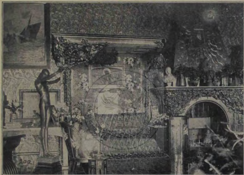
Interiorul unei odăi a principesei, aranjată după indicațiile Altefei Sale.

Luni, la 3/15 Maiu, se făcù serviciul religios la 6 ore dimineața, pentru a câștigă timp. Apoi la 8 ore se dete semnalul prin clopotul cel mare al catedralei; și sosind comisarii guvernului, poporul, al cărui număr