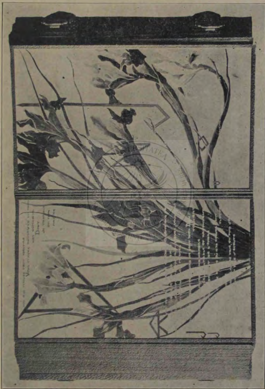
Cartea de pergament ilustrată de A. S. Prințesa Maria.