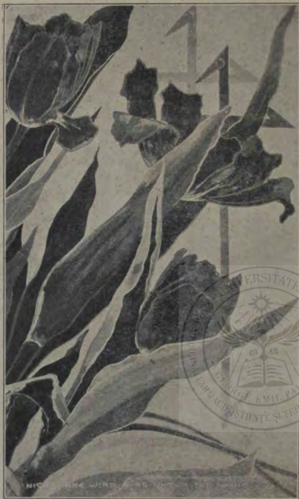
Din cartea ilustrată a A. S. Principesei Maria.