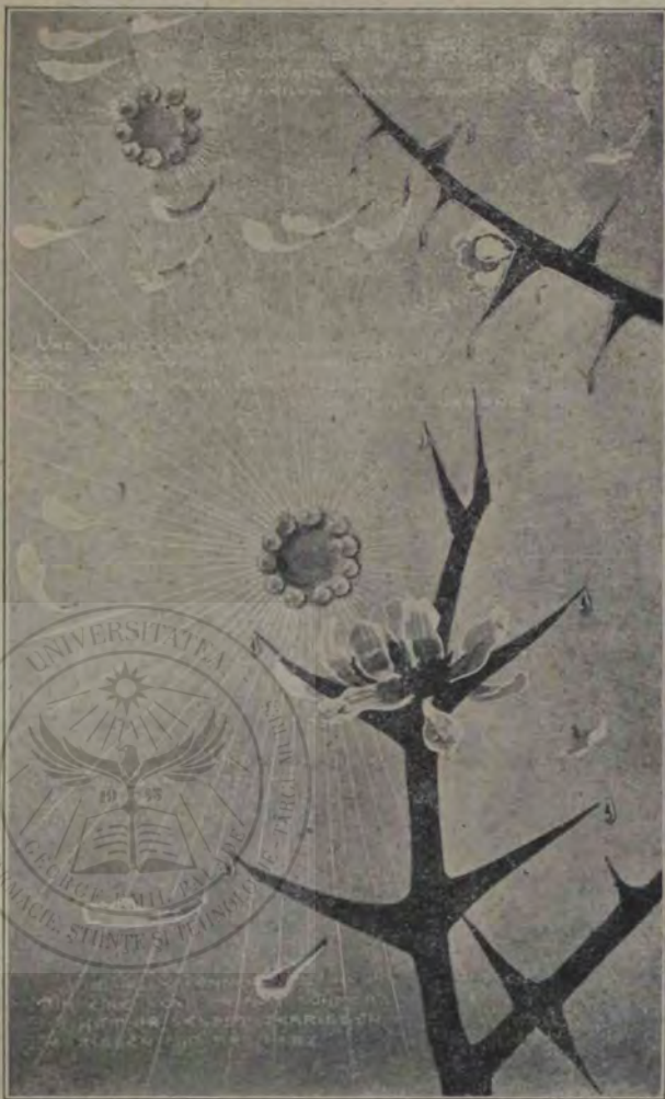
[Din cartea ilustrată a A. S. Principesei Maria.

— Pentru c'am fost bun. Opt ceasuri de lucru voesc dumnealor! Opt ceasuri! Apoi, unde s'au văzut asemenea bazaconii? Se