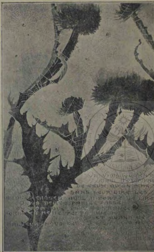
Din cartea ilustrată a A. S. Principesei Maria.

Ba să mă ierte, la mine băeții se scoală odată cu găinile și se culcă după cântatul cocoșilor. Și dacă nu le place, atunci le fac vânt și, hait, pașol, să ne vedem cu bine! Leneși nu-mi trebuie... Fiecare trebuie să muncească, da, că așa e făcut Românul săracu, să muncească: „Îți vei câștigă pâinea ta cu sudoarea muncii!“ Singur Mântuitorul în grădina Get-