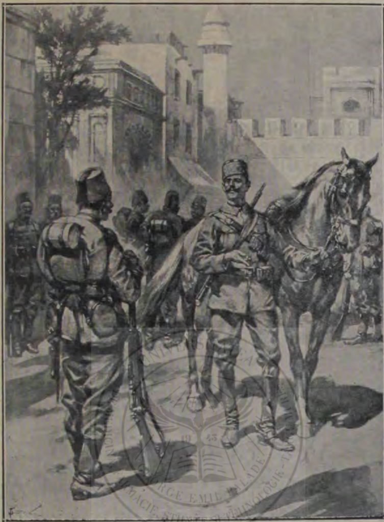
Scenă din retragerea garnizoanei turcești din Tripolis.

intruna. Odată apoi a bătut rău pe unul, și de-atunci l-au lăsat în pace.