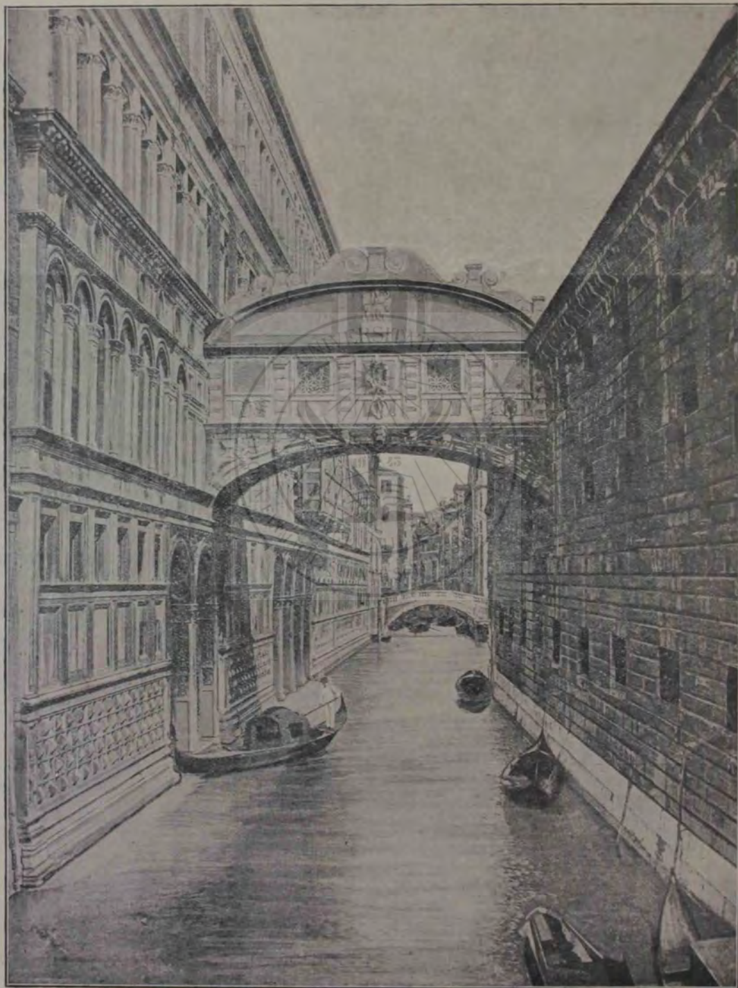
Podul suspinelor, în Veneția.

— Părinte Nicolae, Sfinția Ta mă cunoști de o bună ruptură de vreme acum, așa-i?