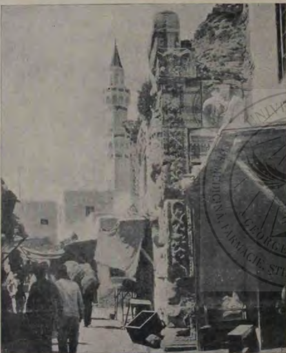
Vederi din Tripolis. Arcul împăratului Marcus Aurelius.