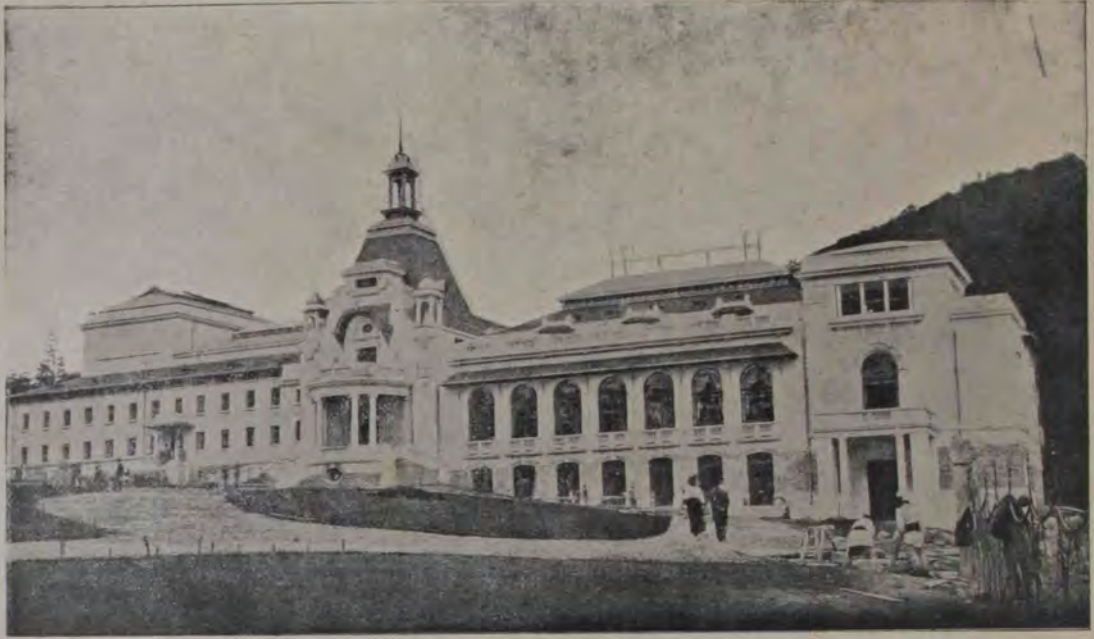
Casinoul din Sinaia, unde astăvară se făceau jocuri de cărți hazarde, cari au produs o indignare în toată presa de dincolo, cerând ca guvernul să le pună capăt.