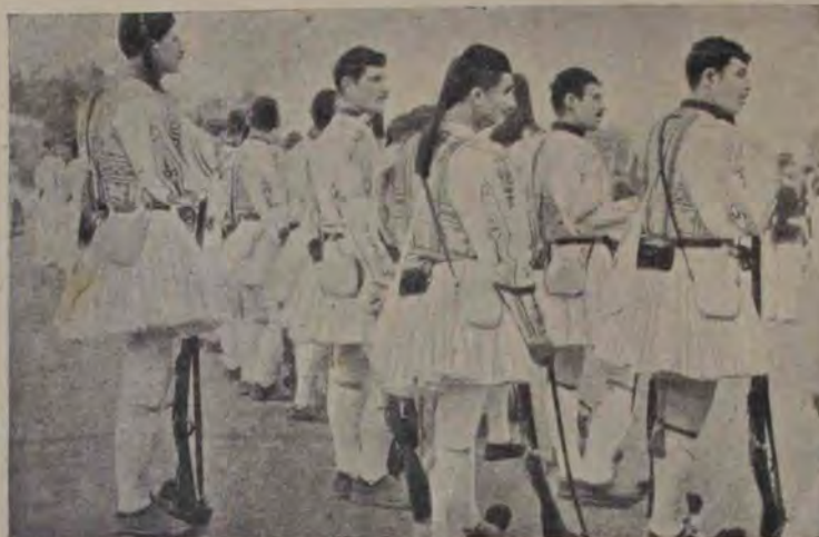
Din războiul balcanic: Infanteriști greci.

pai de dâșii și găseai pe drum o fată, o vadană, ori aveai o ibovnică și o cereai și mergeai după tine, te duceai cu dâșii la o biserică și te cununai. Apoi, nu-ți mai zicea nimene nimic .