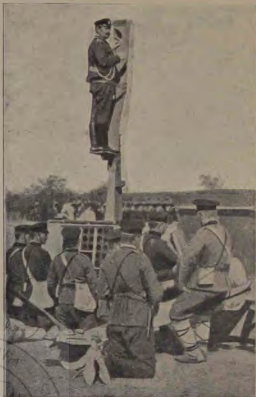
Din războiul balcanic: Ofițer bulgar de artilerie privind de pe stâlp câmpul de luptă.

...De ce nu intri? Te înspăimântă iarna neașteptată? Credeai, că numai la mine nu vei da de ea?.. Doamne, ea nu întreabă de nimeni și nimic. În totul... atât e dureros, că nu lasă să străbată căldura în suflet, atunci