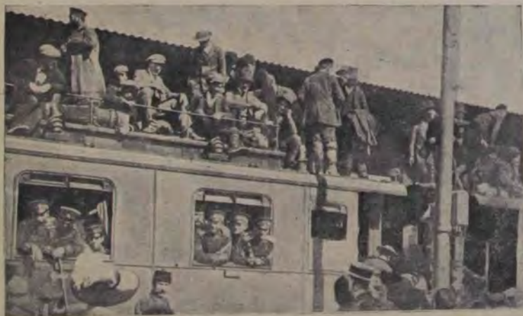
Din războiul balcanic: Rezerviști bulgari pornind spre câmpul de luptă.

— Și — urmă el răsărând și după o mică întrerupere — îl fac pe cea grămadă, cine a fi fost, ceia se zăpăcesc și, tivai băete, peste garduri, peste porți, și doar am auzit lătrat de câni în urmă, treziți din somn și glasuri: „După el! După el! Săriți! Prindeți-ll...” Am auzit câteva garduri pocnind în urmă și împușcături și m-am tot dus cu capul gol, peste câmpuri, peste părae, ierburi și arături, și când s-o făcut ziuă eram la hotarul țării nemțești. Amu, ce să fac eu: dincoace livizorii finanții, dincolo cazacii.