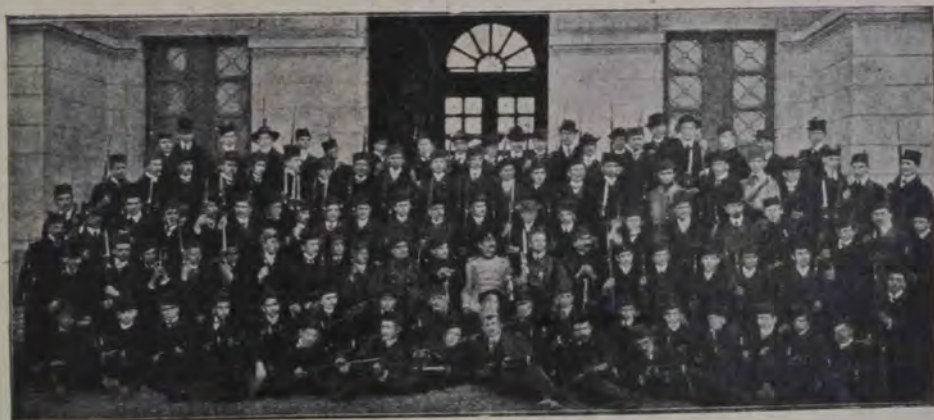
Din războiul balcanic: Studenți sârbi voluntari, cari la izbucnirea războiului s'au înrolat sub drapel să lupte pentru drepturile naționale.

— Tocmai, răspuse el, ceace și vram să vă spun, că nu luă ca amu , cu hurta, ci pe fiecare an din tot satul unu. Și puneă vornicul ochii pe el din vreme și cum știă că și acela nu s'ar duce, numai te pomeneai, într'o noapte, cu casa înconjurată de vătășei și de alți oameni și de nu te dădeai prins și cătai să fugi, te gâbuia la vreo strămoare și-ți aruncă arcanul după gât ca la caii sălbatici. Tu nu vrei să te dai și de-ți eră coperișul de pae, bine de bine, de nu, eșeai pe unde eșea fumul și cu barda în mână, ce aveai, și dacă din cei ce-ți ațineau drumul găseai unul mai slab de inger, strigai: „Fugiți, că dau!“ Ori îți lăsă cărarea slobodă, ori doborai pe unul, de nu, numai te pomeneai cu ștreangul după gât. Dacă scă-