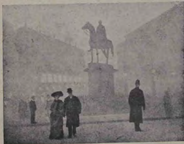
Banca Angliei în Londra la orele 2 după amiază pe o zi cețoasă.

Una din cețele cele mai extraordinare a fost de