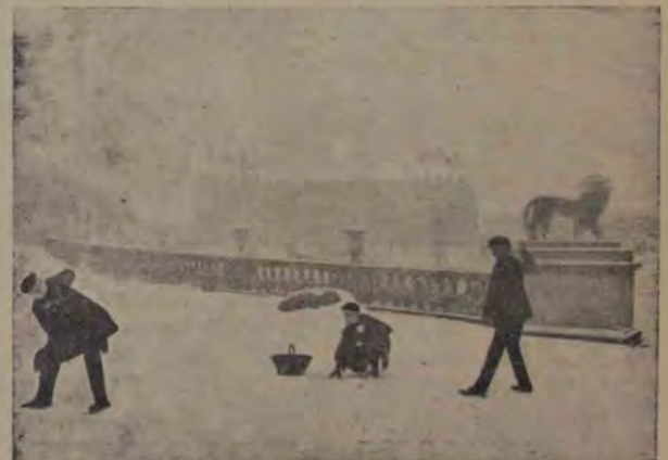
Grădina Luxemburg în ceață, în Paris.

Și acum, de unde provine această ceață, care se întinde ca un cearceaf livid deasupra unor regiuni întregi? E foarte ușor de explicat. Cauzele ceței sunt