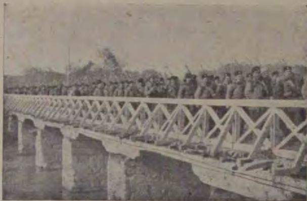
Regimentul al doilea de infanterie bulgar trecând peste un pod în drum spre Adrianopol.

totdeauna, îi acordă totul. D. Duretour cumpără și aducea copilului jucăriile pe cari le dorea, și îl hrănea cu bomboane și prăjituri.