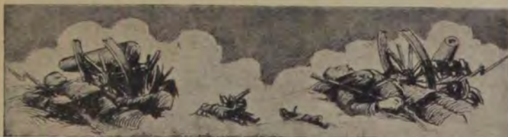
Războiul din Crimeea 1753—56. 45.000 morți. Războiul italian 1859—60. 45.000 morți. Războiul danez în 1864. 250.000 morți. Războiul civil american 1861—65. 800.000 morți.