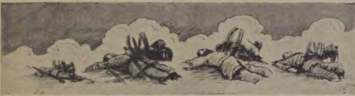
Războiul Austriei cu Prusia în 1866. 45.000 morți. Războiul Germaniei cu Franța, 1870—71. 215.000 morți. Războiul româno-rus-turc 1877—78. 250.000 morți. Războiul ruso-japonez 1905—6. 200.000 morți.

Aceste două chipuri ale noastre arată statistica celor căzuți în războaiele din ultimii 50 de ani. Aici nu-s cuprinși, firește, morții războiului recent din Balcani, cari se urcă cam la 80.000—100.000.