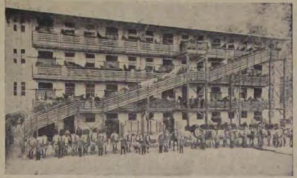
Civilizația noastră azi progresaază uimitor de repede și poate mai mult o dovedește aceasta tocmai chipul pe care-l arătăm noi aci. Chipul acesta arată hotelul pentru cai din orașul Charlottenburg, care e anume întocmit pentru aceste animale. Are patru etaje aranjate cu toate cele trebuincioase cailor.

o ridicare, și apoi o scădere a temperaturii. Sub influința unei călduri momentane vaporii de apă se desfac din pământul umed, din râuri, din lacuri, din mlaștini și mai ales din mare, apoi se răspândesc prin văzduh. Când atmosfera se răcește brusc, vaporii aceștia se condensează și formează o infinitate de picături minuscule cari rămân în suspensiune în atmosferă, ca o pulbere lichidă.