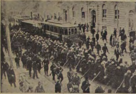
Un grup de prizonieri Turci, trecând pe străzile Belgradului sub paza soldaților Sârbi. În războiul din Balcani dintre Turci o mulțime imensă a căzut în prisoarea dușmanilor. Cu prizonierii popoarele învingătoare au tratat foarte uman și prizonierii nu au avut nici un motiv să se plângă.