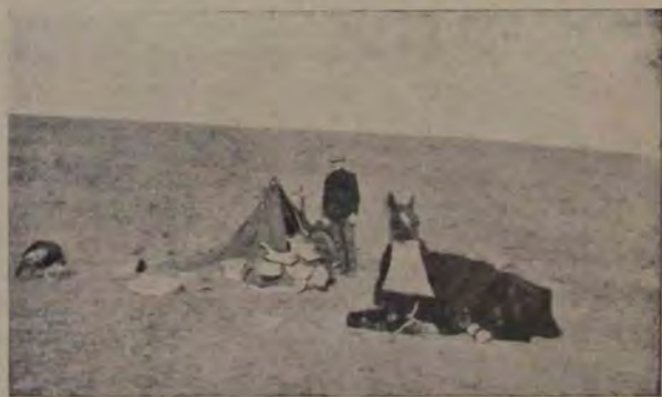
Cortul unui raportor din războiul balcanic în apropierea câmpului de luptă. Ziariștii au fost tratați foarte mășter în acest războiu și nu au putut informă conform adevărului zărele, deoarece cenzura popoarelor războite la ciuntă telegramele și le puneă o mulțime de pedeci la trimisul scrisorilor.

„Dar uită-te la el, uită-te la el, dobitocule, și convinge-te că e leit de d. Duretour; dar privește-i