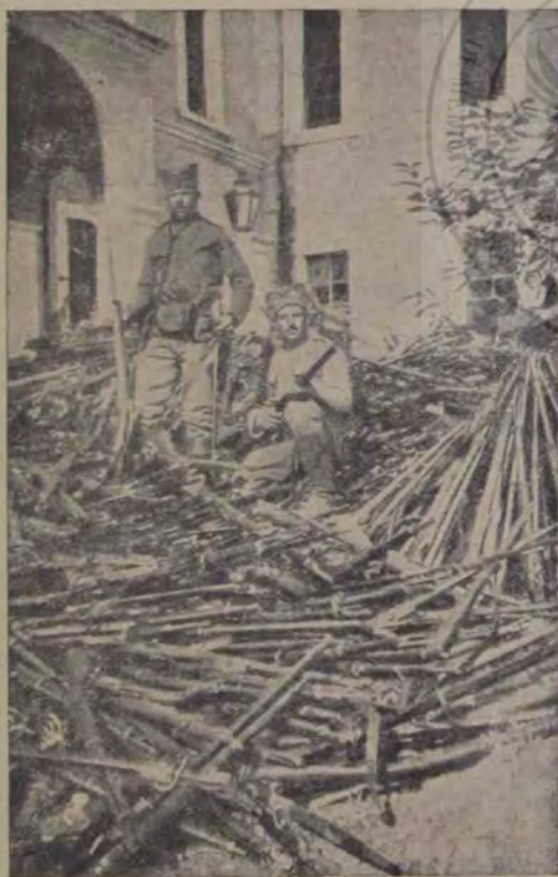
Războiul din Balcani a fost pentru Turci nenorocos pe toată linia și a scos la iveală toate rănilor acestui neam atât de temut odată. În luptele date între oștile otomane și creștine ei au suferit pierderi uriașe și de multe ori au fost nevoiți a se retrage, lăsând pradă dușmanului care întregi de proviant și grămezi de arme. — Chipul nostru arată grămada de puști pe care Turcii au lăsat-o în mâna Sârbilor în lupta dela Cumanovo.

B.: (tot mai întunecat). Vreau, însă îmi place să mă răzim pe ceva tare, nu să pipăi.