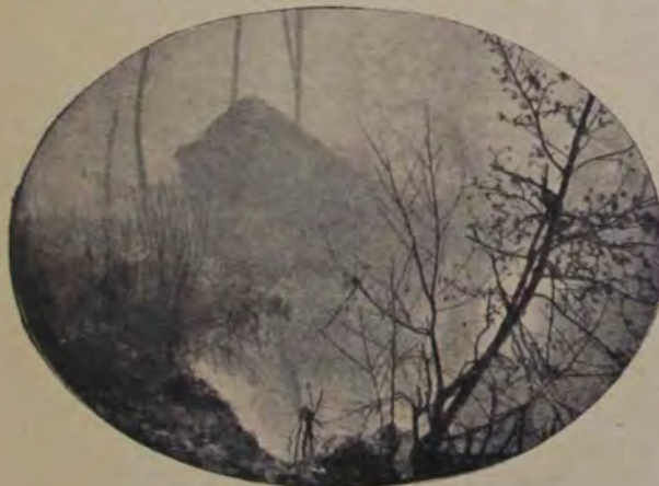
Un sat din împrejurimile Londrei, în mijlocul ceței.