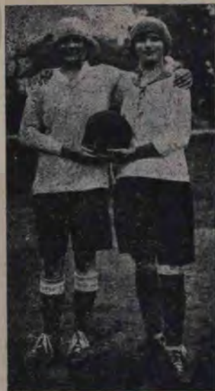
Sportul a luat în vremea din urmă un avânt nemaipomenit. În țările apusene fac sport alături de bărbați și femeile și nu arareori genul gingaș lasă biruitor față de bărbați. Aci arătăm două vestite fotbaliste din Uruguay ieșite victorioase aproape pre-tutindenii.

Mărturisesc că am pierdut și ultima scânteie de timiditate, m'am sculat fără nici un pardon, în picioare, și geamandanele, împreună