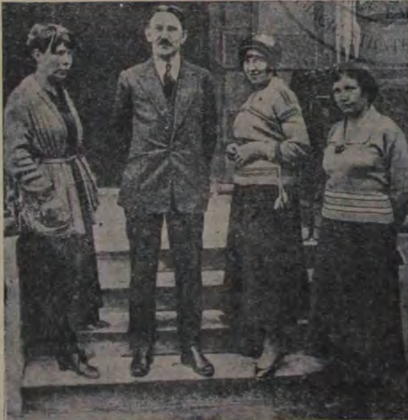
Emanciparea femeii. Sovietele au fost cele dintâi, care au dat depline drepturi și femeilor. Guvernul bolșevic din Moscova drept aceea a numit pe legațiunile sale din țările streine și o mulțime de femei, ca secretare de legații și alte funcționare. Chipul nostru arată pe femeile diplomate atașate cu serviciul pe lângă ambasada bolșevică din Berlin.

În dimineața aceea, când oaspeții goliră casa, când am ramas numai