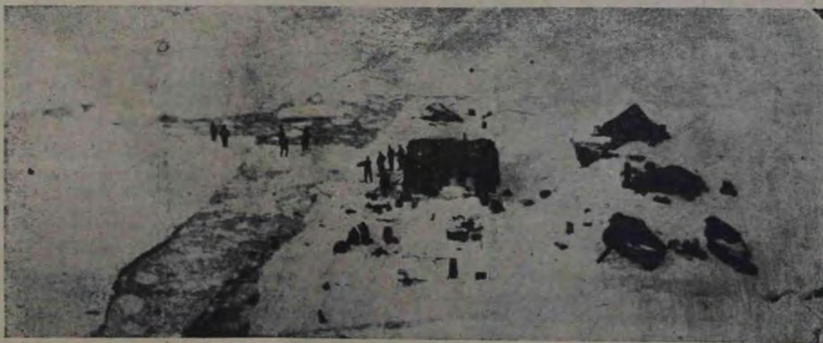
Viața vânătorilor de vulpi albastre pe un sloi de gheață, în momentul când el se desface. Coliba a crăpat toată, amenințând să se surpe

nată celei care există în nordul Canadei. A înființat, adică, unsprezece posturi de vânătoare, ocupate de câte patru sau de câte doi vânători, și în fiecare vară trimite o corabie pentru a încărca blănurile recoltate în timpul iernii, pentru a îndeplini schimbul oamenilor cari se întorc acasă și pentru a aproviziona cu hrană pe cei cari rămân în pustiu de gheață.