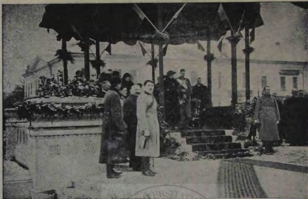
M. S. Regina și A. S. R. Prințul Carol la serbările dela Oradea pentru desvelirea sta-tuiei M. S. Regelul.