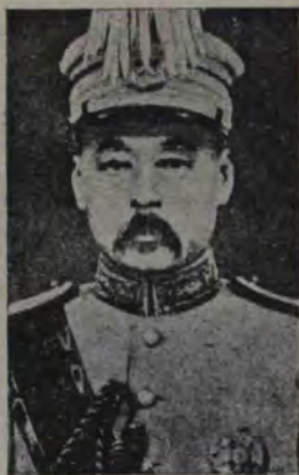
Teng-Ju-Siang unul dintre generalii chinezi, care au comandat pe răscu- lați și au răsturnat guvernul