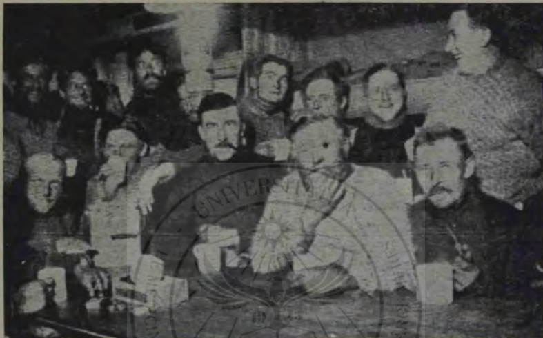
Vânătorii naufragiați în lăuntru colibei lor de pe sloiul de gheață

Dar, navigația pe aceste meleaguri întâmpină greutăți nebanuite, primejdii cu care nu se glumește. Dela un capăt la celălalt, de-a lungul țărmului de răsărit a Groenlandei și în apropierea lui, stau de veghe și împiedică trecerea cele mai formidabile sloiuri de gheață ale mărilor Arctice. Pe dinaintea acestui pământ se scurg neîntrerupt nenumărate „iceberguri” și „banchize,” câmpii enorme de gheață, strânse unele lângă altele, pe cari un curent puternic al Oceanului le târește încet, dar fără răgaz, spre Sud. Inchipuiți-vă o învălmășeală