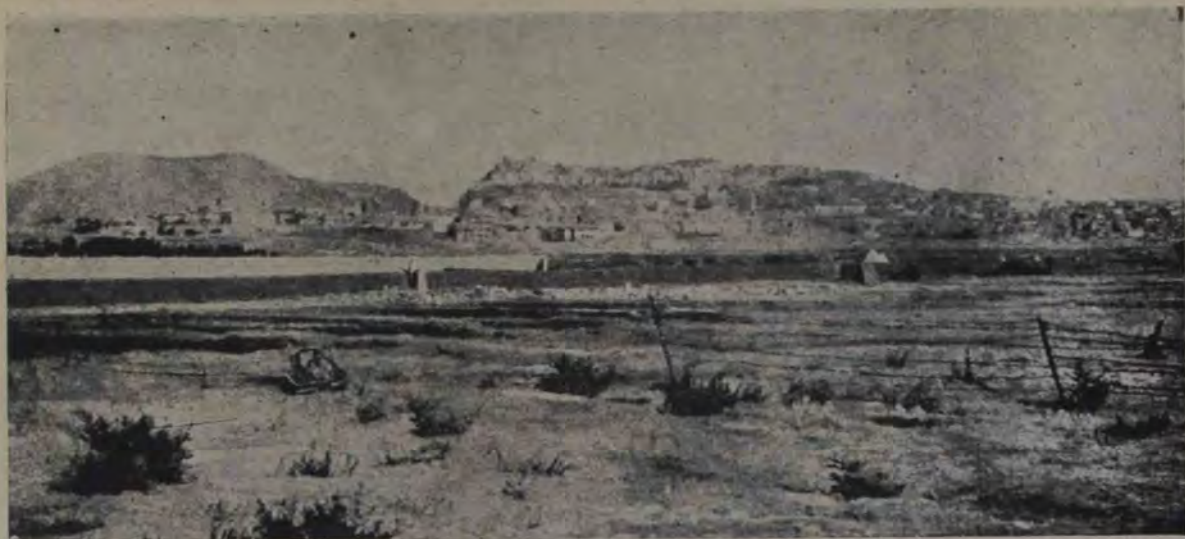
Iată și Angora, noua capitală a Turciei, pe care junii turci au schimbat-o cu Constantinopolul. Angora este un sat mare în mijlocul țării, la loc foarte bine apărat și pentru acest titlu a fost aleasă capitală. Ea acum se ridică, acum răsare așa zicând și vor trece ani și ani până va avea confortul unui oraș modern.

mediabil. Soarta oamenilor mai păstra o licărire de încredere. Cine știe? Poate că mântuirea era în altă parte... Iată pe cei 21 oameni, singuri pe imensa banchiză călătoare, lipsiți de vasul în care își pusese răstătoarea toată speranța de a fi salvați. În mijlocul acestor întâmplări tragice, Danezii își păstrară tot sângele rece (era și greu să nu și-l păstreze, în apropierea Polului), dând dovadă totodată de o admirabilă ingenuozitate. Reușind să salveze merinde din belșug erau apărați împotriva foamei; rămânea numai chestiunea adăpostului. O deslegară și pe aceasta ridicând deasupra ghețarului plutitor o colibă încăpătoare, cu ajutorul sfărâmurilor proprii lor corăbii. O adevărată casă, cu lămpi atârinate de tavan, cu o masă în mijlocul odăii, cu tablouri pe pereți... Tot ceace confortul modern e în stare să ofere unei banchize care coboară singură, pe întinsul mării, fără țintă și fără busolă!