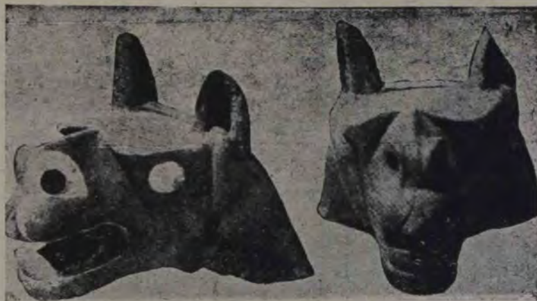
Capete de toxodont stilizate din ceramică, aflate printre ruinele templului din Tihuanacu. Toxodontul a fost un animal vechiu, a cărui urmă a dispărut astăzi cu totul.