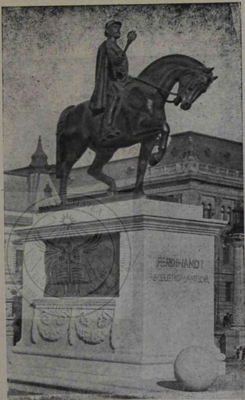
Statuia M. S. Regelui Ferdinand, desvelită în Oradea Mare.

— Nu știu, săraca de mine! Bolnav va fi de nu mai vine acasă. De aseară îl caut și'n pământ și'n