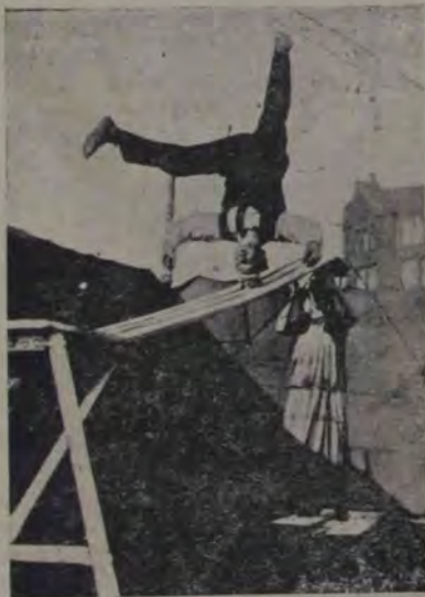
Un truc nou al unui artist de varietate, care merge cu capul pe-o gheată cu roși, păstrând un echilibru perfect, așa dupăcum îl vedem în ilustrația aceasta.

Așa au urmat cercetările, poveș-tile și temerile nouă zile în șir. Dar în ziua a zecea satul întreg se adună alergând spre covăcia lui Pinte-a, unde e coliba aceea goală. Cineva râdea acolo așa de tare și de ră-sunător, încât se auzea peste toată Colibița.