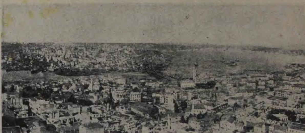
Vederea generală a orașului Constantinopol, vechea capitală a Turciei, părăsită astăzi cu desăvârșire, cu toată frumuseța fără pereche a peisajelor sale și cu toate farmecele Bosforului.