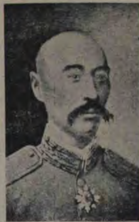
Ciang-Cio-Lin un alt general chinez răzvră- tit, care a respins trupele gu- vernamentale în Mandjuria

Americanii au descoperit un material prin care un glonț nu poate trece cu niciun preț. Din acest material apoi ei fac veste, care apără perfect omul de atacuri de armă, dacăcum se vede și'n ilustrația noastră. Trei revolve se întind spre omul, din față și lui nici că-i pasă de gloanțele lor.