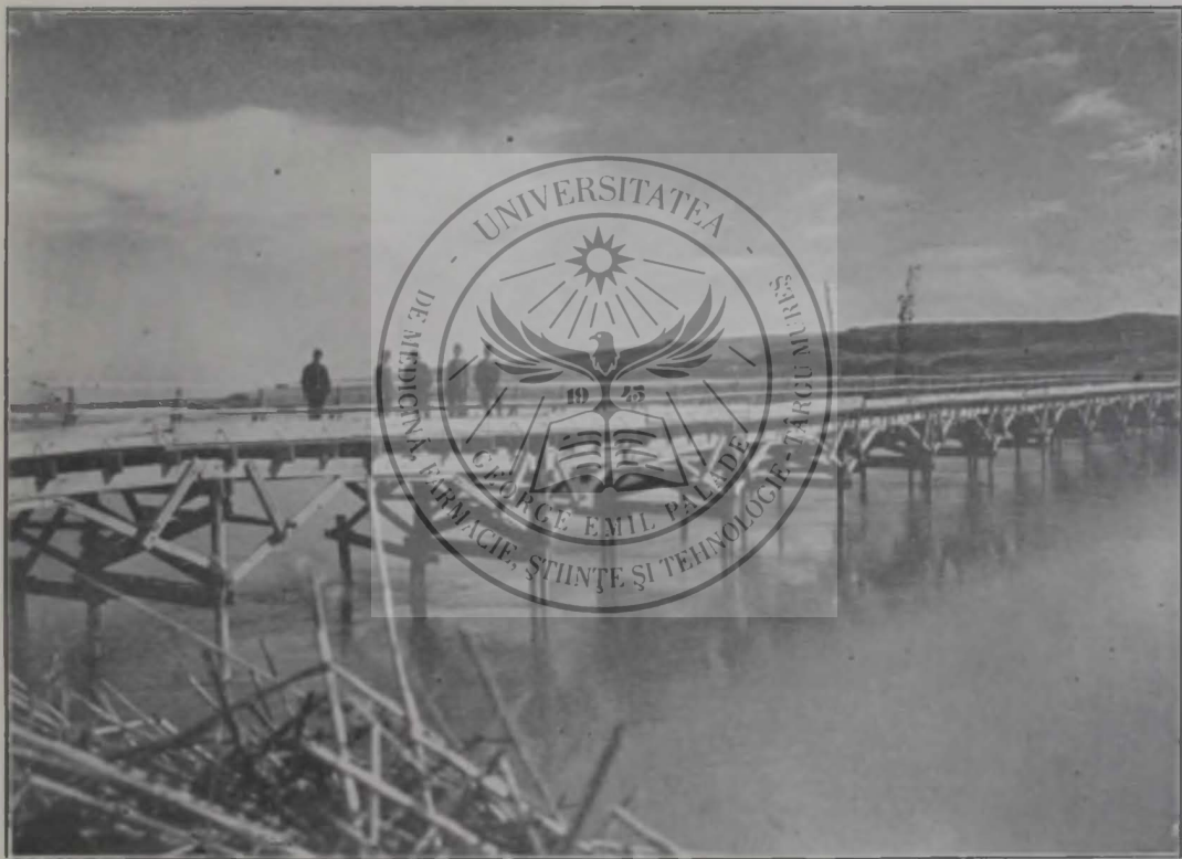
Pod provizor făcut în câteva ore.

Florile aceste vor fi, deci, culturile specifice, naționale, pe care le pot arăta popoarele. Prin aspectul lor deosebit nu vor tulbura armonia vieții omenești, ci vor împodobi-o îmbogățindu-o, arătând tot atâtea laturi noi, întregitoare ale vecinului suflet omenească. Nu e mai mare și mai adânc înrădăcinat în firea omenească dreptul individualului la viața lui individuală, decât dreptul unui popor la cultura lui națională. Un singuratic trăiește și biruiește