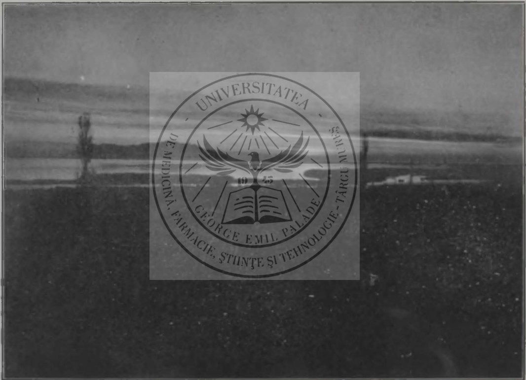
Apusul soarelui la țărmul Mării egeice. Insula Samotrachi.

Biruința culturii, în acest fel înțeleasă, înseamnă biruința omenimei, înseamnă împrăștierea întunerecului fatal legat de mâna de pământ în care marea ființă, care e omul, e prins