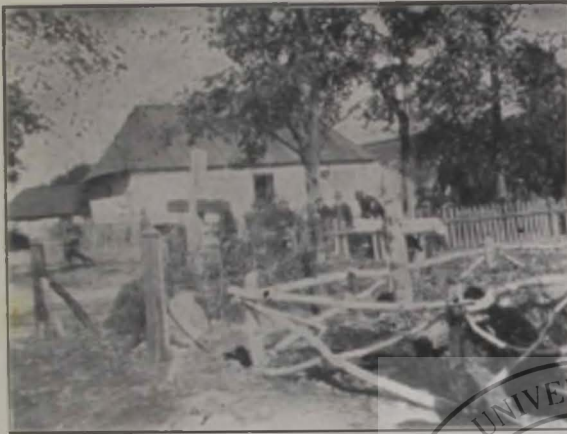
Crucile adevăraților eroi.