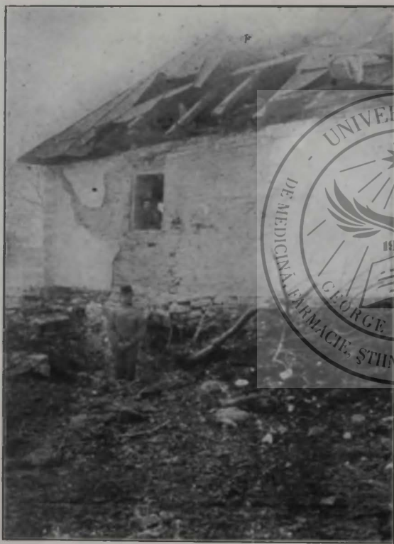
Un singur granat de-al nostru este de-ajuns.

Înainte de toate mă atrăgeau publicațiile „Academiei române”, pe cari le avea în număr complet, fiind membru ordinar al ei. De câte ori se întorcea dela București, aducea maldăre întregi de cărți cu sine. Se umpleau rafturile. Cu câtă evlavie îl ascultam cum vorbește despre București, despre sesiunea „Academiei române” și cum îmi schinteiau ochii de bucurie, când primiam „în cînste” câte o carte prețioasă. — „D'apoi, place-ți. Irate-al meu?” era fraza stereotipă, cu care mă întreba — și numai că-mi punea în mână volumul dorit. Așa, îmi aduc aminte cum ani dus în triumf odată acasă poeziile complete ale lui Alecsandri, pe cari le avea în ediția, ceva mai scumpă, dela Socec —, încă nu apăruse