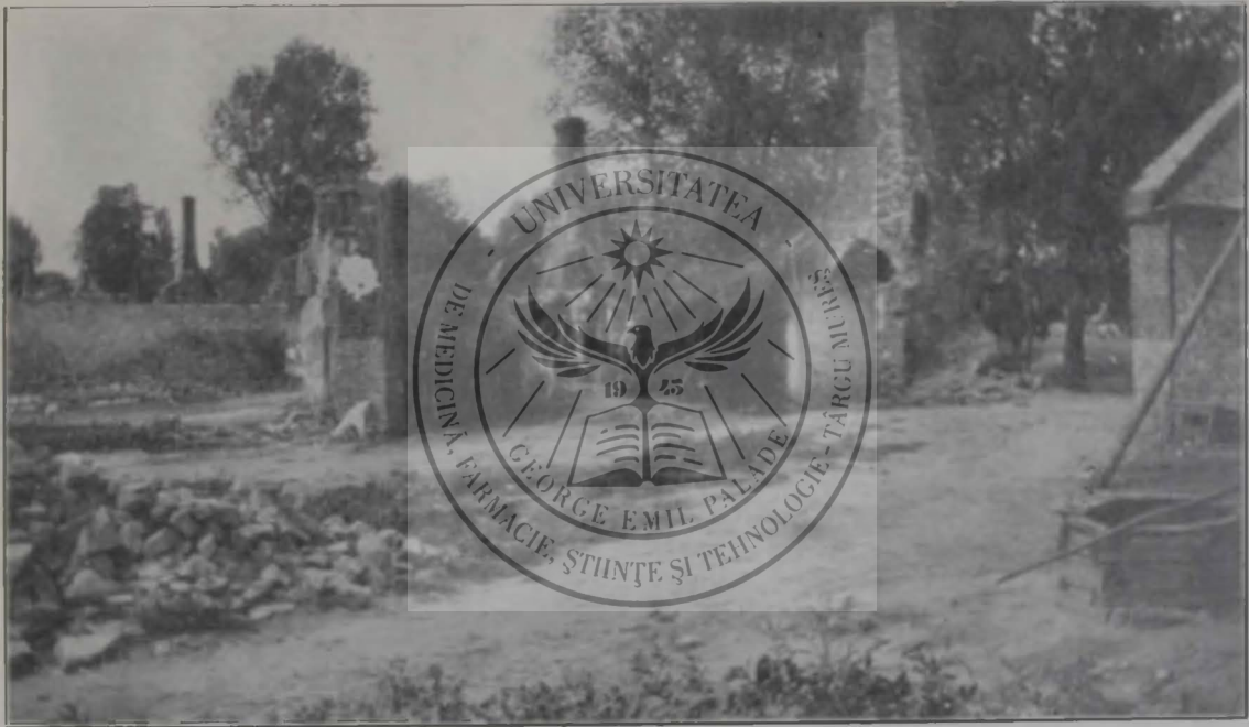
Ravagiile artileriei Austro-Ungare.