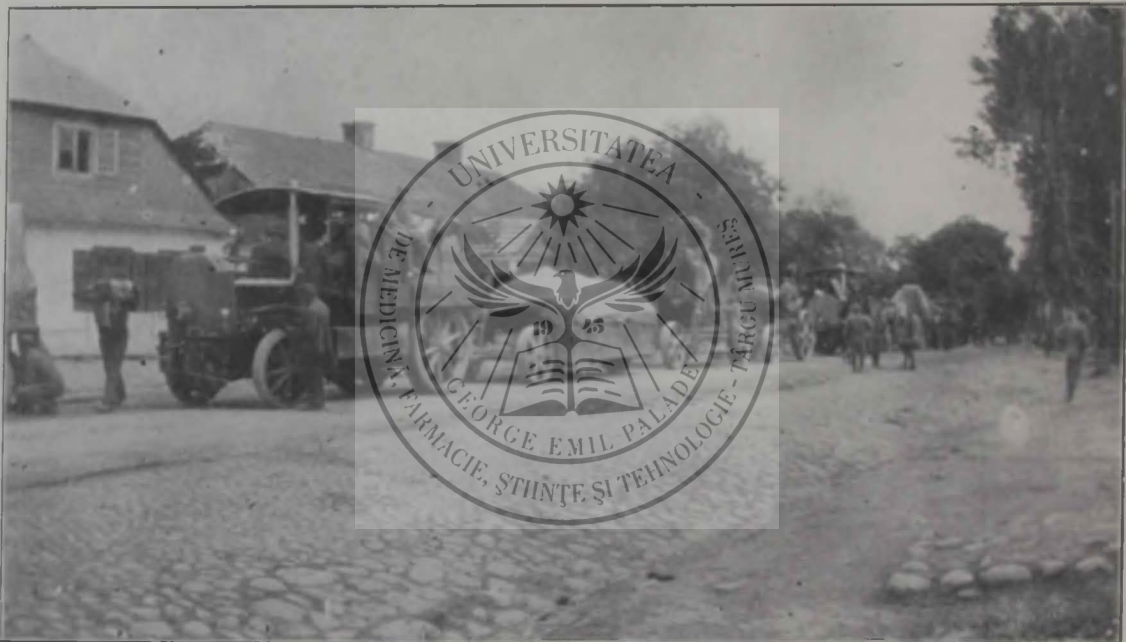
Mortiere austro-ungare de 30·5 cm. în formațiune de marș.

În noaptea de vară, după căldura zilei, pluta sub bolți întunecoase puternica mireasmă ascuțită a bradului. Din necuprinse depărtări, pe