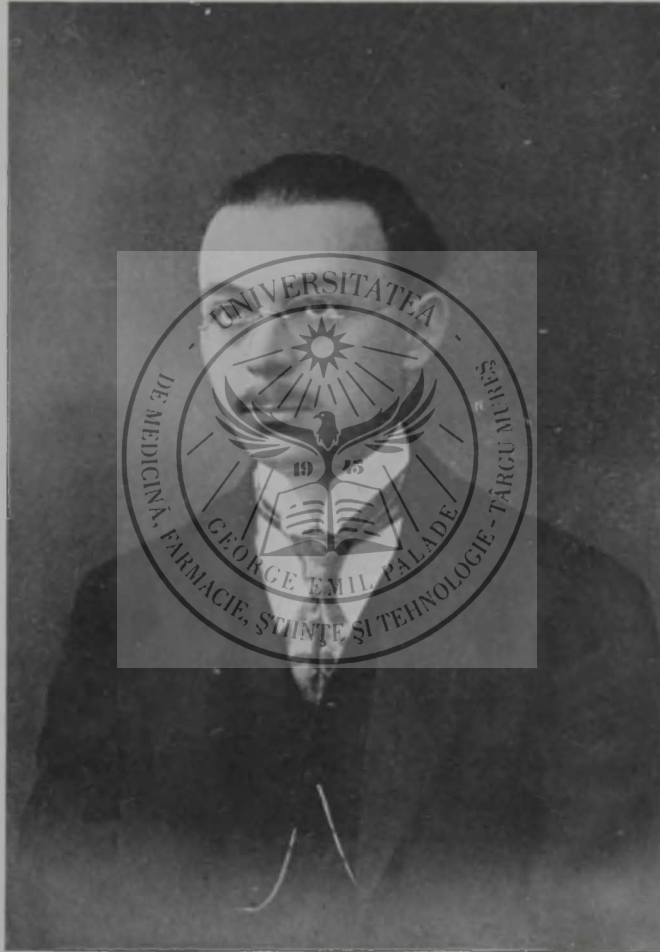
† TIT LIVIU BLAGA.