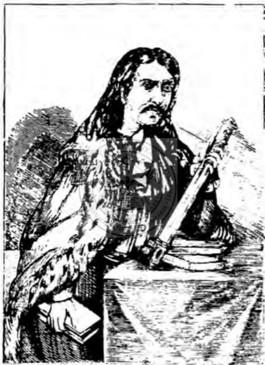
Printul D. Cantemir