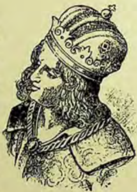
Albert de Austria.

După mórtea lui Sigismund urmă Albert de Austria. Acesta vedēnd suferințele țeranilor din partea nobililor, le mai ușură încât-va sórtea, prin aceea, că le dedú voie de a putea trece la alt stăpân, dacă li se va părē, că sunt prea asupriți, însă mai întâiú aveau să plătescă datoriile, ce le aveau la stăpânií cei vechi. Albert a domnit numai doi ani. Următorul lui fú