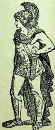
Alexandru cel Mare.

În etate de 22 de ani (334 a. Chr.) Alexandru sã puse în fruntea unei ostiri numãroase constatãtoare din Macedoneni și Greci