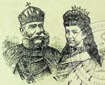
Francisc Iosif I. și Elisabeta.

Când se sui Maiestatea Sa pe tron țera întregă se afla în cea mai mare neorânduie și ferebere, revoluția cuprinsese țera întregă. Capii acestei revoluțiuni erau Kossuth și Görgey . La început cei răsculați fură norocoși, căci generalii împărătesci, până când împăratul ceru ajutor dela țarul (împăratul) Rusiei Nicolae . Acesta trimise o oște de 200 mi în Ungaria. După-ce răsculații fură învinși la Timișoara , generalul oștei ungurești Görgey depuse armele la Vilagos (13 Aug. 1849), er' Kossuth fugi în țeri streine.