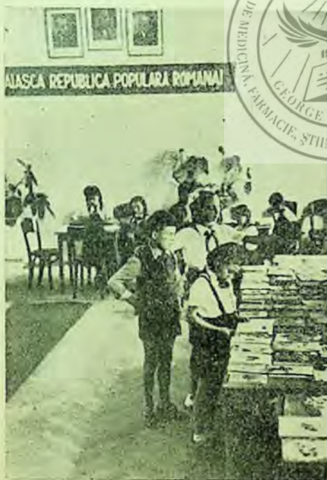
Cititori copii în fața expoziției de cărți organizată de secția de copii a bibliotecii centrale regionale din Timișoara

Pentru a face cunoscute bibliotecarilor sătești noi metode de popularizare a cărții, biblioteca centrală a organizat consiături și recenzii cu cititori în mai multe comune din regiune. Astfel au fost organizate consiături asupra cărții „Secerișul” în comunele Satchinez, Iecea Mare și Făgel. Au fost organizate recenzii la Mosnita Nouă asupra cărții „Pământ deștelenit” în limba maghiară, la Deta „Brazdă peste haturi” și la Șag „Mitreă Cocor”.