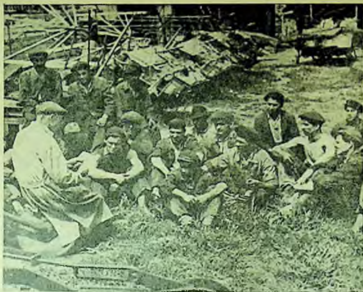
O citire în colectiv, la gospodăria agricolă colectivă din comuna Periș, regiunea București

de biblioteca căminului; cultural și de bibliotecă centrală raională. La fiecare umbrar se află deasemenea o bibliotecă de onoare.