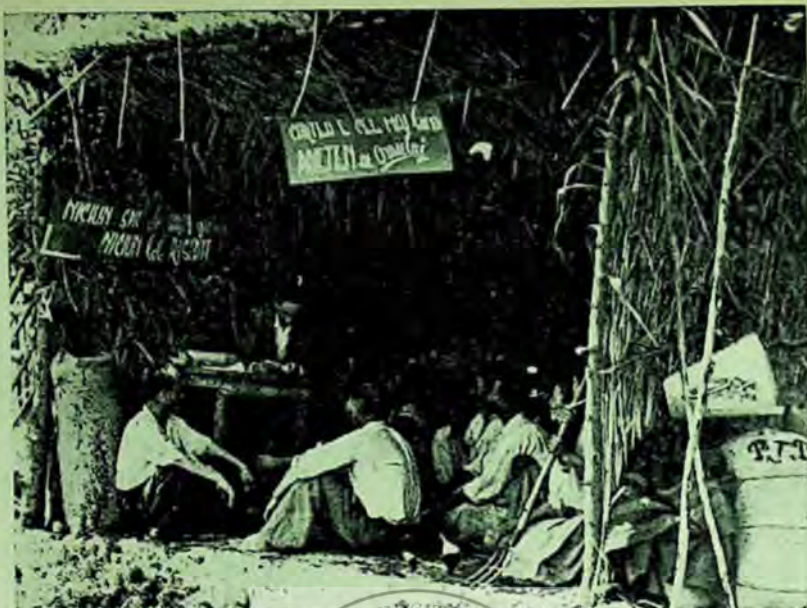
O citire în colectiv. sub umbrat la aria satului Spătărei, regiunea București