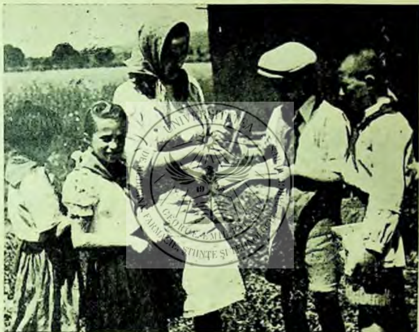
Pionierii din colectivul bibliotecii distribuie cărți acasă la țărani

Intrecerea ne-a ajutat ca în lunile când muncile agricole încep, numărul cititorilor bibliotecii noastre să se ridice în mod simțitor față de celelalte luni. În același timp activitatea