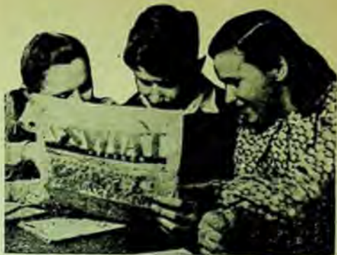
O lectură plăcută în sala Casei de Cultură din Soplicovo

Dintre marile biblioteci de masă, o deosebită atenție merită biblioteca publică din Varșovia, înființată în anul 1907. Ea a îndeplinit până în anul 1928 rolul de bibliotecă națională. Ocupația hitleristă a fost fa-