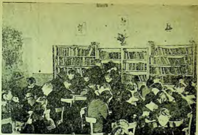
Sala de lectură a unei biblioteci publice pentru copii din Varșovia

Mari schimbări se vor produce și în componența fondurilor de cărți; se va ridica nivelul ideologic în ceea ce privește alegerea cărților științifice și de literatură, iar fondurile bibliotecilor se vor completa cu cărți marxiste-leniniste și de știință popularizată.