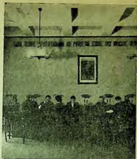
Un aspect al sălii de lectură la biblioteca Sovromtractor