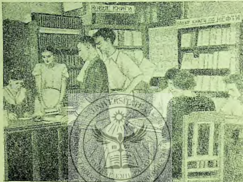
Sala de împrumut la biblioteca centrală tehnico-științifică la unitatea A.Z.N.E.F.T.

În decursul concursului au fost organizate 65 de expoziții de cărți și s'au îm-