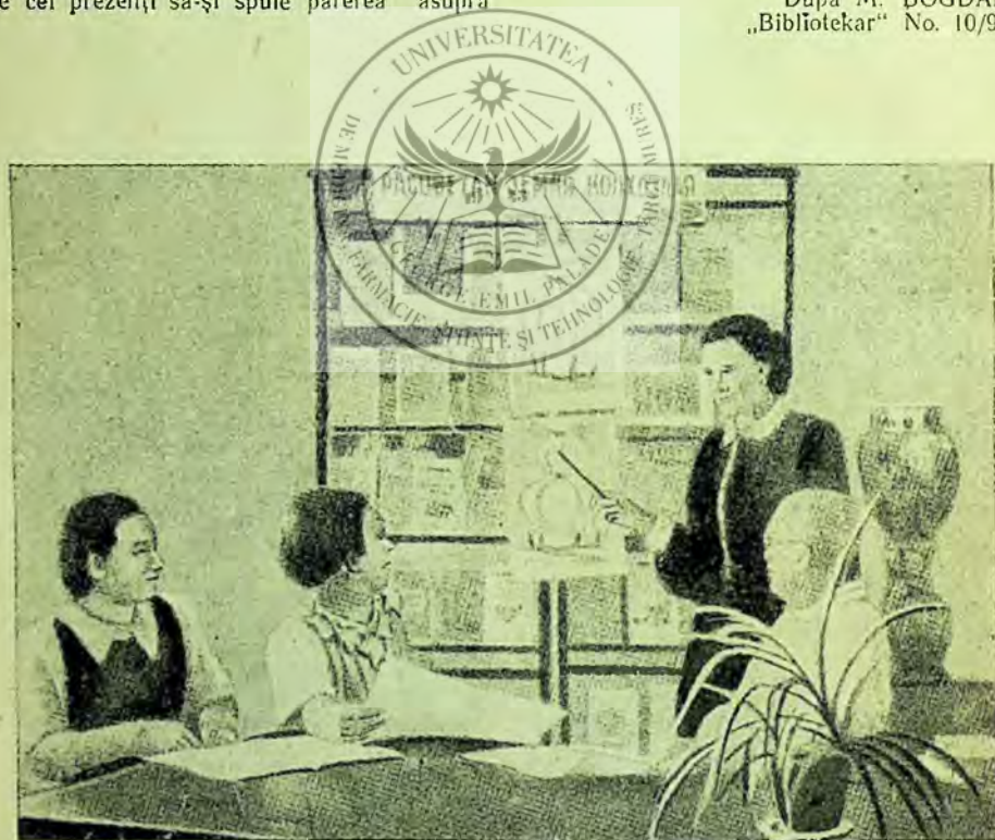
O expunere bibliografică la biblioteca orașenească „A. P. Cehov” din Ialta

După M. BOGDAN „Bibliotecar” No. 10/1952