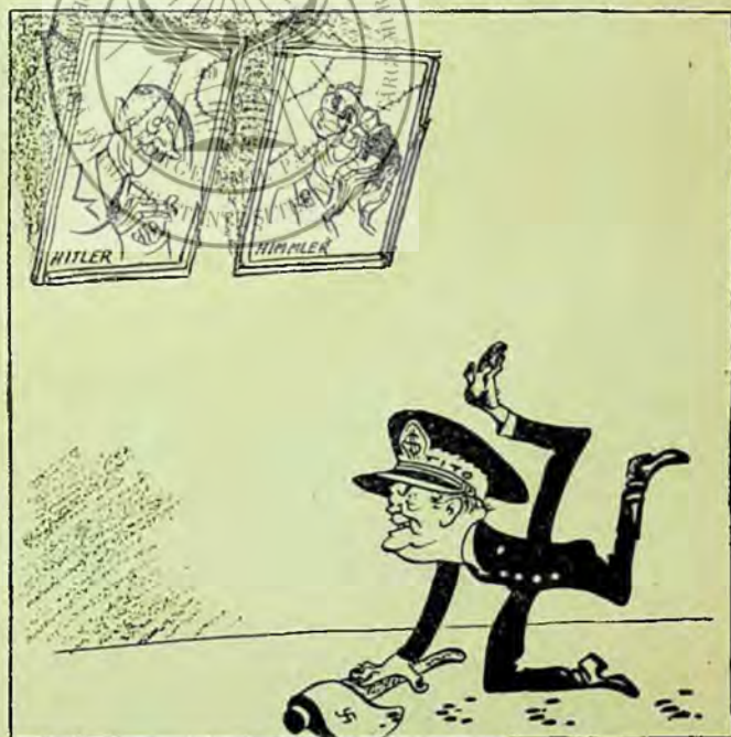
După chipul și asemănarea lor

Grija pe care o are bibliotecara pentru munca ce i s'a încredințat, o face să acorde o atenție deosebită ridicării nivelului ei politic, ideologic și profesional. Ea participă cu regularitate la seminariile raionale cu bibliotecarii sătești, care se țin lunar la Deta. A-