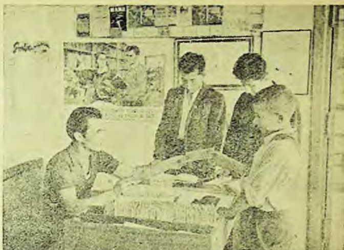
Deservirea cititorilor la biblioteca raională Târgoviște.

selor de citit din comună, în perioada de iarnă deplasarea cititorilor din aceste sate la bibliotecă devenind foarte anevoioasă.