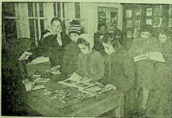
Deservirea cititorilor copii, la biblioteca raională Focșani.

Un bun mijloc pentru îndrumarea bibliotecilor în munca de popularizare