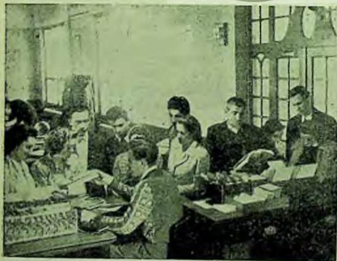
Sala de împrumut a bibliotecii regionale din Tg. Mureș

Dar îndrumarea cititului este tot atât de necesară și pentru cititorii care po-