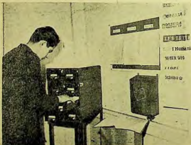
Fișierul articolelor de ziare și reviste dela biblioteca Centrală a Capitalei.

Muncind cu multă dragoste, învățând din metodele avansate ale bibliotecarilor sovietici, folosind presa pe scară din ce în ce mai mare în munca cu cititorii, colectivul bibliotecii Centrale își va îmbunătăți calitatea muncii ajutând pe cititori să devină nu numai oameni culti și bine pregătiți sub raportul politic, cultural și profesional, dar și bine informați întotdeauna și la curent cu tot ce se publică în presă.