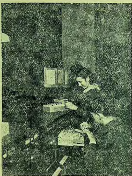
Cititorii consultă catalogul sistematic al bibliotecii regionale Tg. Mureș.

Seminariile lecțiilor de ideologie au oglindit lipsuri serioase în ceea ce privește nivelul politic al unor bibliotecari. Fără îndoială, asemenea lipsuri n-au putut fi remediate cu totul în cele câteva lecții la care au asistat, dar cei în cauză și-au luat angajamentul ca pe baza cunoștințelor ce și-au însușit la curs să continue a face studii temeinice în această direcție de îndată ce vor ajunge acasă.