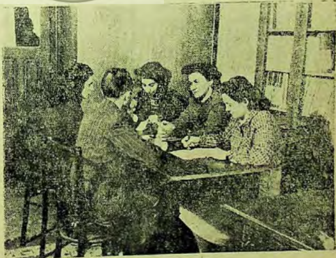
Colectivul bibliotecii regionale din Iași, într-o ședință de colaborare cu reprezentantul A.R.L.U.S.

O atenție deosebită a acordat colectivul bibliotecii regionale ajutorării bibliotecilor de la sate în direcția popularizării cărților agrotehnice. Ea a organizat în acest