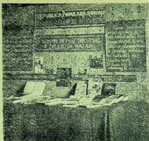
Expoziția de cărți organizată cu prilejul seriei literare

țională ca de exemplu: Poziția Partidului Comunist Român față de curentele șovine și revizioniste de Gh. Gheorghiu-Dej, cuprinsă în culegerea Politica națională leninist-stalinistă a P.M.R. ; lucrări din Editura de Stat pentru literatură politică care popularizează realizările înfăptuite de oamenii muncii din țara noastră ca: Viața nouă în satele patriei noastre , Munca înfrățită și altele.