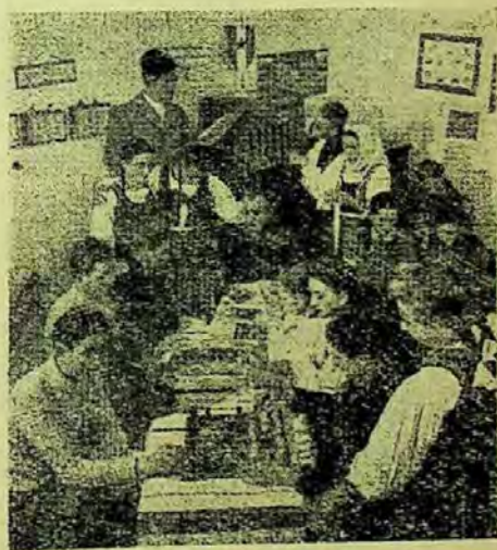
Bibliotecara căminului cultural din comuna Lengyel, județul Tolna

județene din cele 19 județe ale țării, bibliotecile de plasă și satești. În afară de acestea mai funcționează 14 biblioteci orașenești în orașele nereședință de plasă care sînt direct de bibliotecile județene respective. Bibliotecile județene au un fond de cărți fix care variază între 20.000-30.000 volume și un fond mobil care se ridică uneori pînă la 100.000 volume, a cărui evidență e ținută separat și care e destinat numai organizării bibliotecilor mobile. Achiziționarea cu cărți atît a bibliotecilor județene cit și a celor de plasă se face direct de la colecturile din Budapesta. În cele mai multe din aceste biblioteci se duce o vie activitate. Astfel Biblioteca Județeană din Bekescsaba duce o intensă activitate de popularizare a cărților folosind ca metode de muncă agitația vizuală, îndrumarea cititorilor, etc. Biblioteca are peste 5000 cititori înscriși. Ea posedă un fond bogat de cărți rare care cuprinde numeroase capodopere ale literaturii maghiare și străine. Biblioteca a înființat un registru la îndemina cititorilor, unde ei își exprimă dorința și să se procure anumite cărți care nu se află în fondul bibliotecii, în legătură cu diferite probleme literare sau prin care fac anumite critici asupra felului cum lucrează bibliotecarii. Un bibliotecar special însărcinat răspunde foarte ope-