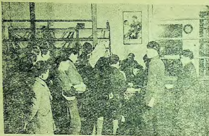
Secția de copii a bibliotecii regionale Arad