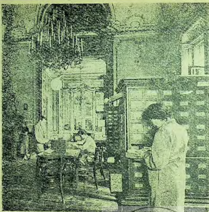
Sala de cataloage a bibliotecii Szabo Ervin

bibliotecarii; culege, studiază și generalizează experiența bibliotecilor fruntașe.