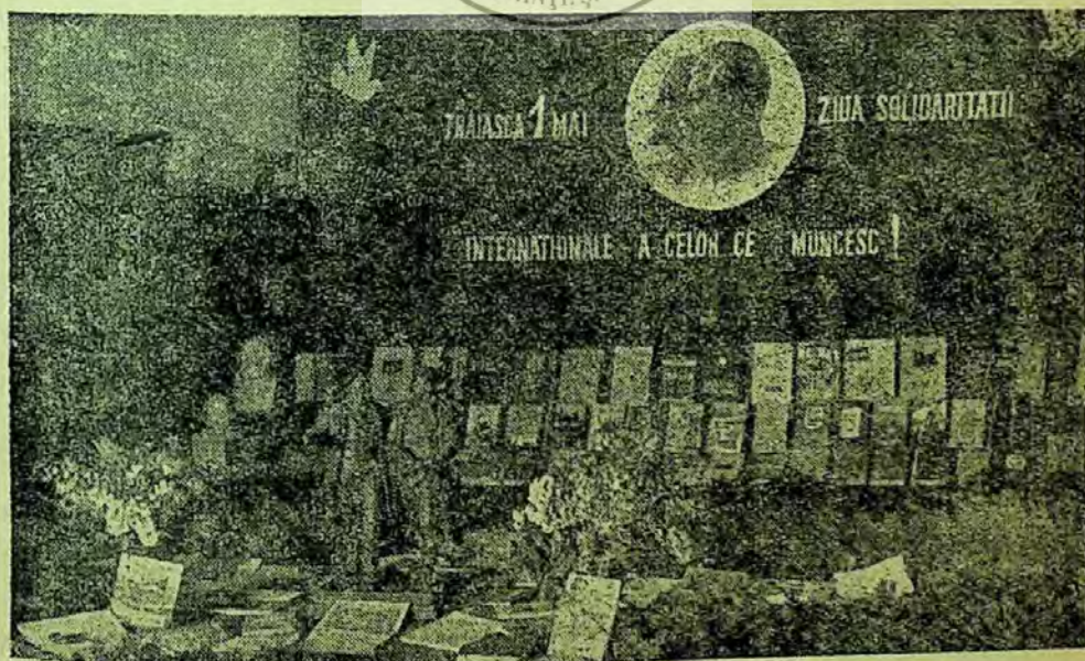
Expoziție de cărți organizată de biblioteca Comitetului de întreprindere al Combinatului Metalurgic Reșița

Cu experiența acumulată pînă acum în desfășurarea muncii cu cartea, avînd și sprijinul Comitetului de întreprindere, colectivul bibliotecii Comitetului de întreprindere al Combinatului Metalurgic Reșița va putea să desfășoare în viitor o activitate mai bună, rezolvînd cu succes toate sarcinile ce-i revin.