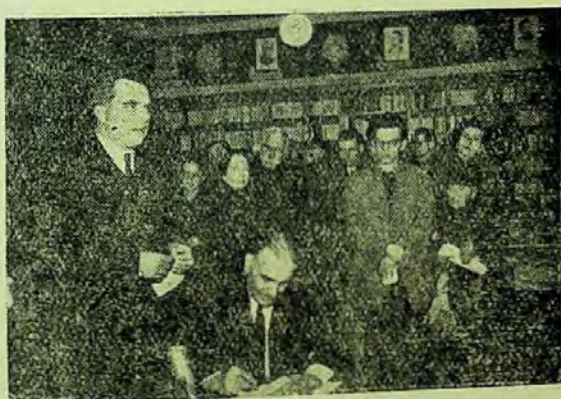
Scriitorul Zaharia Stancu la o întîlnire cu cititorii organizată de Librăria Noastră Nr. 1

Bibliotecarii au nenumărate posibilități să stabilească legături între scriitori și cititori. Făcînd acest lucru ei contribuie în mod eficace la educarea cititorilor, la atragerea lor în număr mare la bibliotecă, ceea ce înseamnă un imbold prețios pentru scriitori, care vor depune astfel o muncă mai însuflețită și mai rodnică, știînd că nu scriu degeaba, că prin lucrările lor, ei ajută într-adevăr, la creșterea omului de tip nou în regimul nostru.