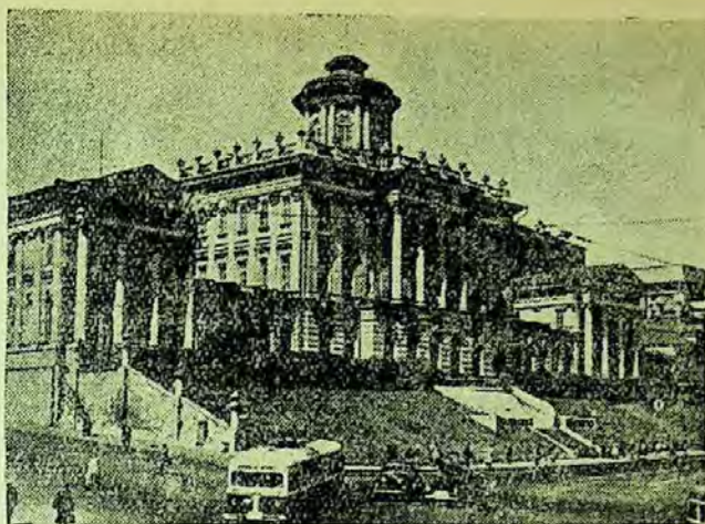
Una din clădirile Bibliotecii de Stat a U.R.S.S.

Unele biblioteci cumpără cărți de artă. Aceasta este foarte bine, deoarece cărțile de artă largesc orizontul studenților. Biblioteca Institutului de mine din Moscova a organizat o expoziție a cărților rusești de artă din domeniul muzicii, picturii și teatrului.