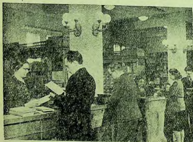
Studenții aleg cărți la Biblioteca Institutului politehnic Kirov din Ural