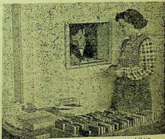
Deservirea cu cărți a studenților la biblioteca Institutului agronomic din București

Un rol important în această direcție îl are secția de documentare. Ea întocmește la cerere bibliografii pentru cadrele didactice și pentru absolvenții Institutului, care își pregătesc lucrarea pentru examenul de stat. De asemenea în secție există cataloage cu sumarele periodicele de specialitate și