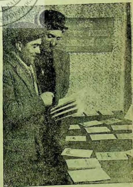
Colectiviștii cercetînd expoziția de cărți

Expunerea bibliografică s-a terminat. Dar colectivști mai zăboveau în încăperea colțului roșu. Ei au ținut să viziteze expoziția de cărți întocmită de biblioteca colțului roșu în colaborare cu cea a cîmînului cultural pe tema: