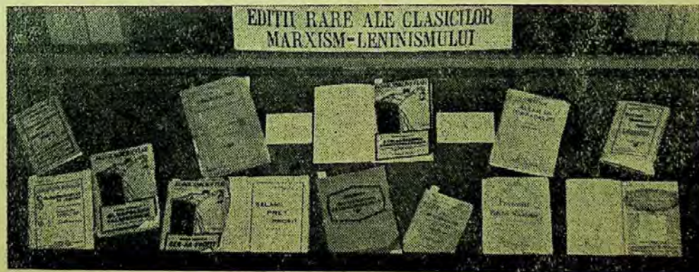
Una din vitrinele Bibliotecii centrale universitare din Cluj

Sperăm că publicarea rezultatelor primelor noastre încercări va servi colegilor noștri de la bibliotecile cu caracter similar, drept bază de pornire pentru discutarea problemelor ridicate mai sus.