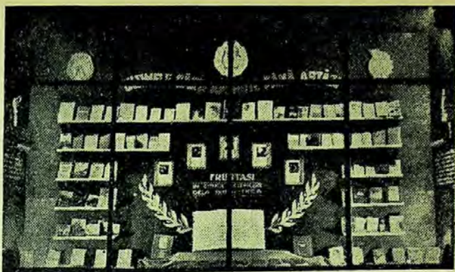
Vitrină pentru popularizarea cărților noi și a cititorilor fruntași, la biblioteca clubului uzinelor Ernst Thälmann, din Orașul Stalin

Un mijloc bun pentru atragerea atențiunii muncitorilor asupra cărților tehnice de care au nevoie, este și stația de radioamplificare. Cel puțin odată pe săptămînă stația transmite scurte expuneri asupra cărților noi sosite în bibliotecă. Asemenea expuneri s-au făcut asupra cărților: Pentru descoperirea și folosirea rezervelor interne ale producției , Dispozitivul Rijkov , ajutor prețios în munca strungarilor de C. Valerian