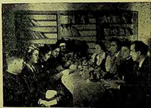
In timpul discuției finale

Succesele dobîndite pînă în prezent de biblioteca din Botoșani au creat un imbold și mai puternic în sînul colectivului acestei bibliotecii de a munci cu mai mult elan la popularizarea concursului „Iubiți cartea”. În planul de muncă al bibliotecii pe anul acesta au fost înscrise o serie de noi recenzii, consfătuiri, seri de ghicitori literare. Iar pentru o mai bună pregătire a participanților, colectivul bibliotecii, cu sprijinul membrilor corpului didactic din comisia de concurs, a luat inițiativa de a organiza și consultații menite să ajute pe participanții la concurs la clarificarea unor probleme insuficient înțelese din lecturile lor. În același scop, se lucrează în prezent la o bibliografie care să cuprindă recenzii sau studii mai importante referitoare la cărțile înscrise în bibliografia concursului.