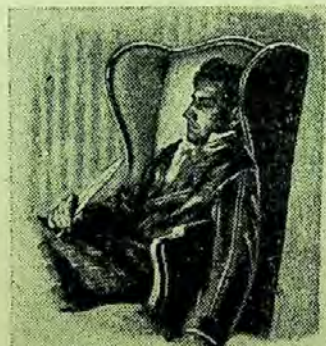
A. S. PUȘKIN EVGHENI ONEGHIN