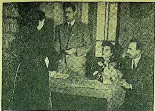
Inminarea brevetelor și insignelor de „Prieten al cărții” la biblioteca raională din Botoșani

nouă în ajutorul participanților la concurs au fost organizate și conferințe asupra vieții și operei unor anumiți scriitori din bibliografia concursului.