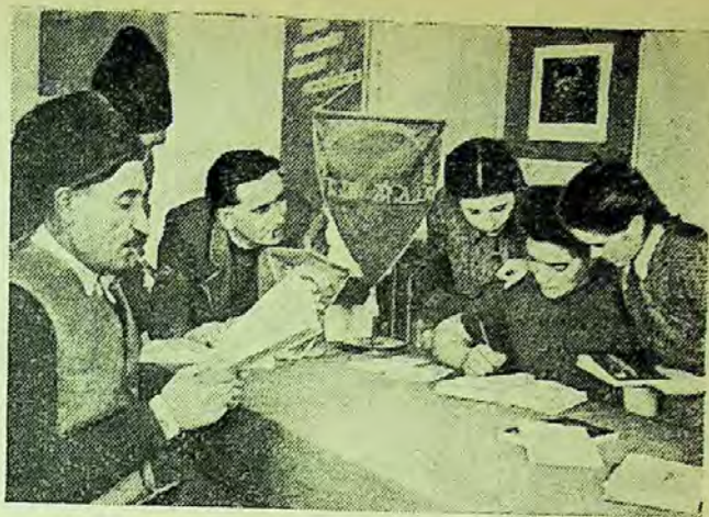
Biblioteca de la G.A.C. din comuna Arcuș, raionul Sf. Gheorghe

O altă problemă în planul de muncă al bibliotecii regionale o constituie organizarea schimbului interbibliotecar. Metodistii care se deplasează pe teren au primit sarcina să întocmească împreună cu bibliotecarii liste de cărți disponibile pentru schimbul interbibliotecar, liste care urmează să fie trimise tuturor bibliotecilor interesate. Prin acest schimb se va îmbunătăți componența fondului de cărți al bibliotecilor raionale și satești, alegîndu-se titlurile conform necesității acestor biblio-