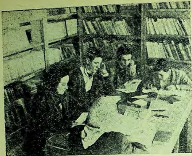
Biblioteca satească din com. Leu, regiunea Craiova

lecturii cititorilor, la atragerea lor spre bibliotecă. Pentru buna organizare și desfășurare a acestor manifestări bibliotecarul este ajutat atât de cadrele didactice din comună cât și de Comitetul executiv al sfatului popular comunal, care consideră munca cu cartea un prețios mijloc de educare a țăranilor muncitori. În luna ianuarie, de pildă, țăranii muncitori au ascultat re-