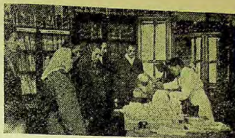
Secția de împrumut a bibliotecii

În introducere se atrage atenția cititorilor asupra avantajelor cititului metodic, planificat, dîndu-se cîteva îndrumări pentru modul cum trebuie folosit planul de lectură. De asemenea le solicităm ob-