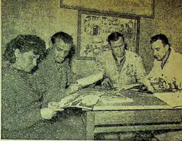
Biblioteca Clubului Semănătoarea

De aceea, se împrumută de la alte biblioteci cu care a stabilit relații permanente de schimb, sub formă de împrumut interbibliotecar.