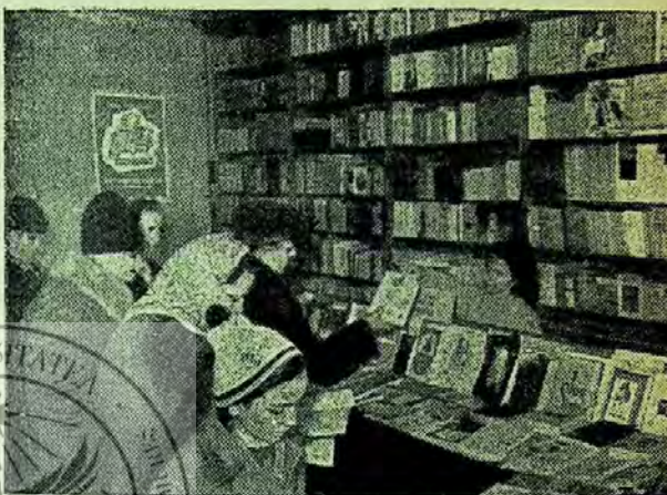
Aspecte de la Expoziția cărții

bine au făcut editurile că au pus la dispoziția vizitatorilor — am spune mai exact: a cititorilor — condici de impresii și sugestii care vor fi de un real folos conducerii editurilor în orientarea activității lor pentru perioada viitoare. În timp ce unii sugerează anumite cărți pe care ar dori să le vadă tipărite, ținînd seama de profilul editurii respective, alții susțin necesitatea unei prezentări grafice și mai îngrijite, sau ridică, uneori cu destulă competență, probleme privind ilustrarea cărților, legatul sau broșatul lor, etc.