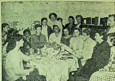
La biblioteca de casă nr. 19 din raionul Grivița Roșie.