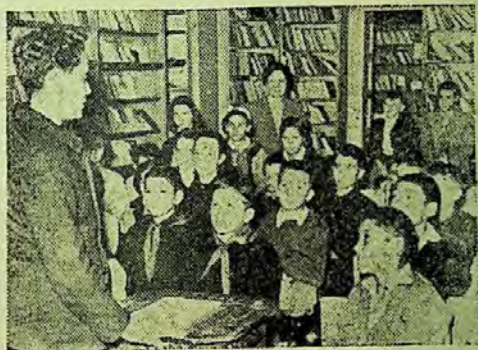
Seara literară organizată de biblioteca A.R.L.U.S.

O acțiune de mare amploare cu care se va încheia sărbătorirea Lunii Prieteniei va fi un concurs organizat la Buftea în rîndurile muncitorilor fabricii de bumbac și în rîndul sătenilor cu tema: M. Șolohov, romancier . Pregătirile acestei manifestări s-au făcut cu