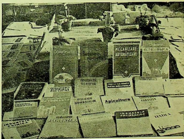
Standul de reviste tehnice din cadrul expoziției organizată de I. D. T.