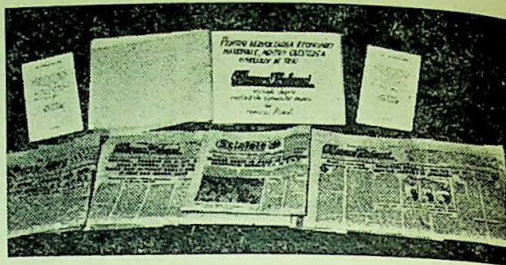
Albumul întocmit de Biblioteca regională Ploiești pentru popularizarea documentelor Plenarei C.C. al P.M.R. din 13—14 iulie 1959