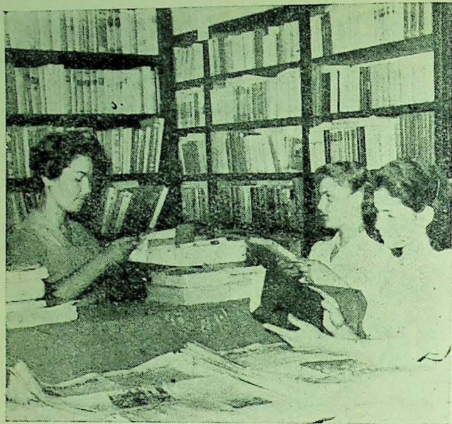
Sala de împrumut a bibliotecii clubului