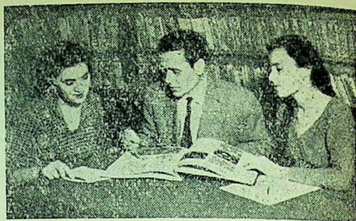
La biblioteca fabricii de confecții „Gh. Gheorghiu Dej”

De asemenea, biblioteca a organizat și urmărit activitatea celor 4 cercuri de citit, înființate în fabrică în scopul îmbunătă-