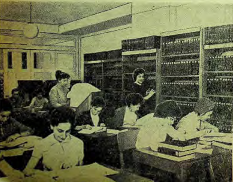
Aspect din sala de lectură a bibliotecii C.D.I.P.C.

Biblioteca mai posedă o prospectotecă, în curs de dezvoltare, o colecție de