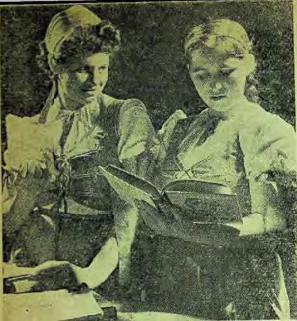
Tinere cititoare răsfoind ultimele noutăți, sosite la biblioteca din satul Bodo, raionul Lugoj, regiunea Banat

Biblioteca raională din Sebiș a folosit cu mult succes la cursurile agrozootehnice proiecțiile de diafilme legate de conținutul lecțiilor predate. Diafilmele pe temele: Prevenirea sterilității la animalele domestice, Cultura trifoiului și a borceașului, Soiurile noi de plante de înaltă productivitate etc., i-au ajutat pe colectivități să-și întregască cunoștințele căpătate la cursuri.