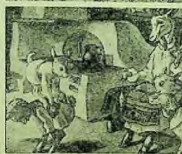
Imagini din diafilmele „Insurecția armată din August 1944”, „Sculptura și grafica românească după 23 August”, „Organizarea muncii într-o brigadă zootehnică” și „Capra cu trei iezi”.

tatori vizionează, anual, producția de diafilme a Studioului cinematografic „Al. Sahia”, adică cca. 300 000 de spectatori, în medie pe zi. E mult, dacă ne gândim că în anul acesta numărul spectatorilor a crescut cu 100% față de anul trecut și e încă puțin, dacă ținem seama de posibilitățile existente, de amploarea activității cultural-educative ce se desfășoară astăzi în întreaga țară, de vasta rețea de așezăminte culturale și școli.