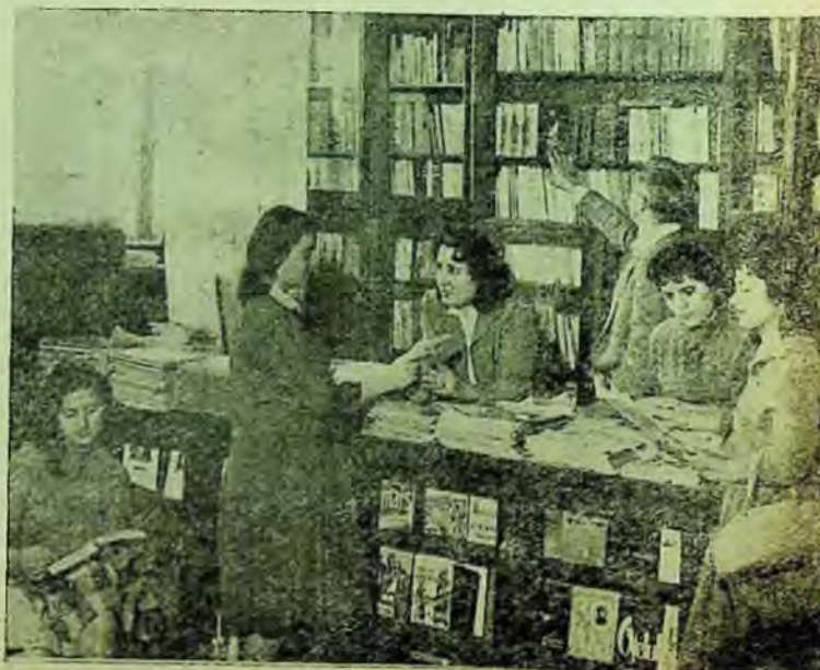
Un aspect de la Biblioteca clubului Uzinelor „7 Noiembrie” din Capitală