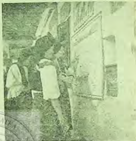
Cititorii de la Biblioteca comunală Ponor căutîndu-și numele pe „Harta satului“

Pentru început, am căutat să fac din bibliotecă un loc atrăgător. Am așezat cărțile — așa cum învățasem — după clasificarea zecimală, am întocmit indicatoare și liste bibliografice simple. Cu ajutorul cadrelor didactice, am organizat propaganda vizuală a cărților biblio-