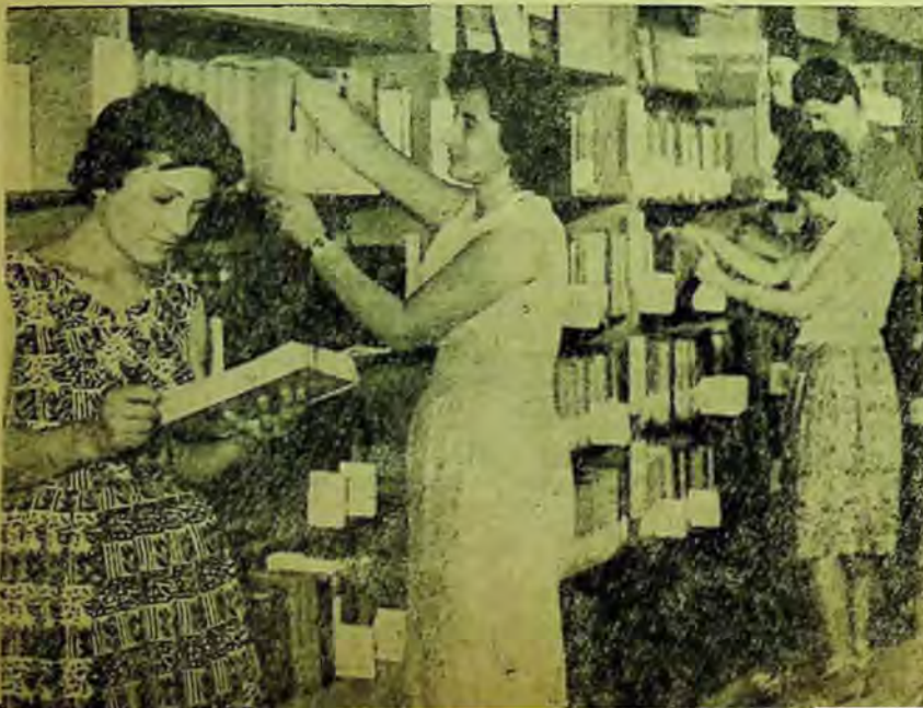
Cititori alegîndu-și cărți pentru împrumut de la Biblioteca raională Focșani.