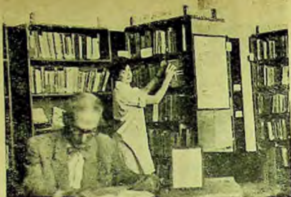
Una din sălile cu acces liber la raft în Biblioteca regională Iași