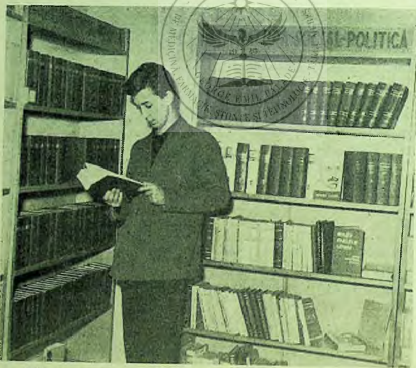
Biblioteca raională „Al. Vlahuță” din Capitală. Un cititor alege și o lucrare social-politică.