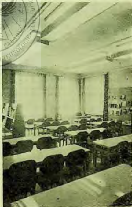
— Sala de lectură pentru tineret a Bibliotecii populare orășenești din Praga

Carnetele de cititori, furnizează date interesante despre lectura tineretului. După fiecare vizită a cititorului la bibliotecă se notează în carnet lucrarea împrumutată (în special beletristica și