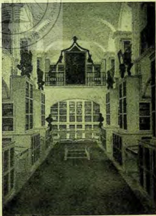
Interiorul Bibliotecii Teleki-Bolyai.