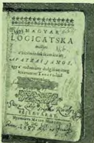
Un unicum: Apáczai Csere János: Logica Alba Iulia 1654.