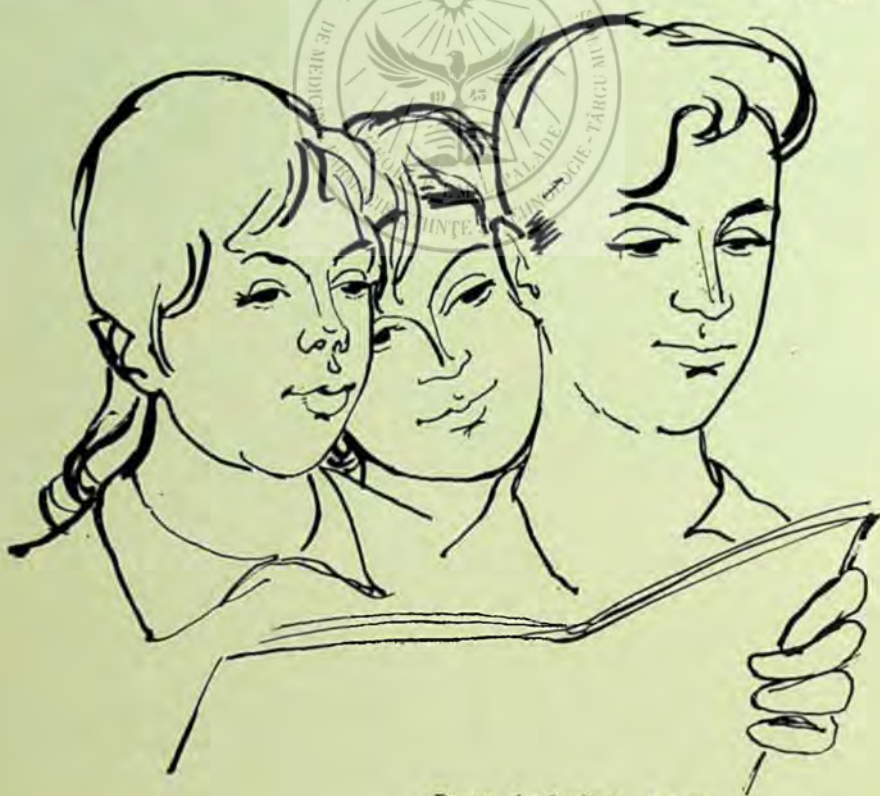
Desen de Ludovic Balogh