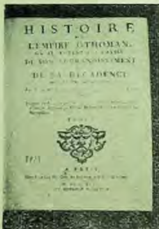
Dimitrie Cantemir: Istoria Imperiului otoman. Paris, 1743.